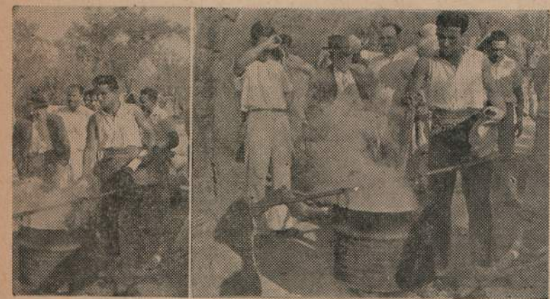
Recluidos del Campo de Concentración de "La Muñeca" preparando la comida.

Un poco tarde y luego de escucharle a usted en sus irradiaciones por la onda de Radio "El Espectador" de esa tierra de libertad y de leer ávidamente su libro "Campos de Concentración en América", que refleja la realidad paraguaya en todos sus aspectos, he querido llegar a usted para expresarle mis congratulaciones por la sinceridad y valentía con que sopesó en sus comentarios esta realidad despótica de mi patria. La aurora de libertad se asoma tras la negra noche dominante; los corazones juveniles presienten que sus sacrificios no han sido vanos y que la libertad está pronta de su alumbramiento. Entonces, usted, querido amigo (amigos somos quienes perseguimos un mismo ideal), retornará a esta patria de los naranjos floridos, no como un "buceador", sino como de los nuestros, que tuvieron sus horas de vigilia para saber —tras cada noche de insomnios— dónde orientar sus pasos en cada amanecer. Lo tendremos a usted como el portavoz de las inquietudes revolucionarias pretendidas ahogarse por la horda policial y que en las noches calladas nos ponía en contacto con el auténtico jefe —el Coronel Rafael Franco— desde esa centenario de libertades, la grandiosa cuna hospitalaria Montevideo.