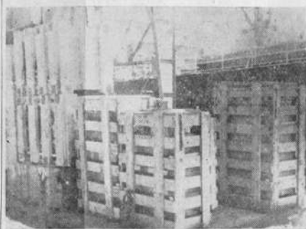
Sobre el vagón, junto al buque "Pardo", se van apilando los cajas donde cuidadosamente embaladas llegan las válvulas de gran tamaño para equipar el trasmisor "Marconi's Wireless"

El acto de la inauguración será fijado una vez que la armadura y las pruebas sean satisfactorias, probablemente en el corriente mes, y trataremos de rodearlo de los detalles inherentes a la importancia del servicio. Hemos trabajado con verdadero entusiasmo y nos han ayudado mucho en distintos aspectos de las gestiones, que sabemos destacar en oportunidad.