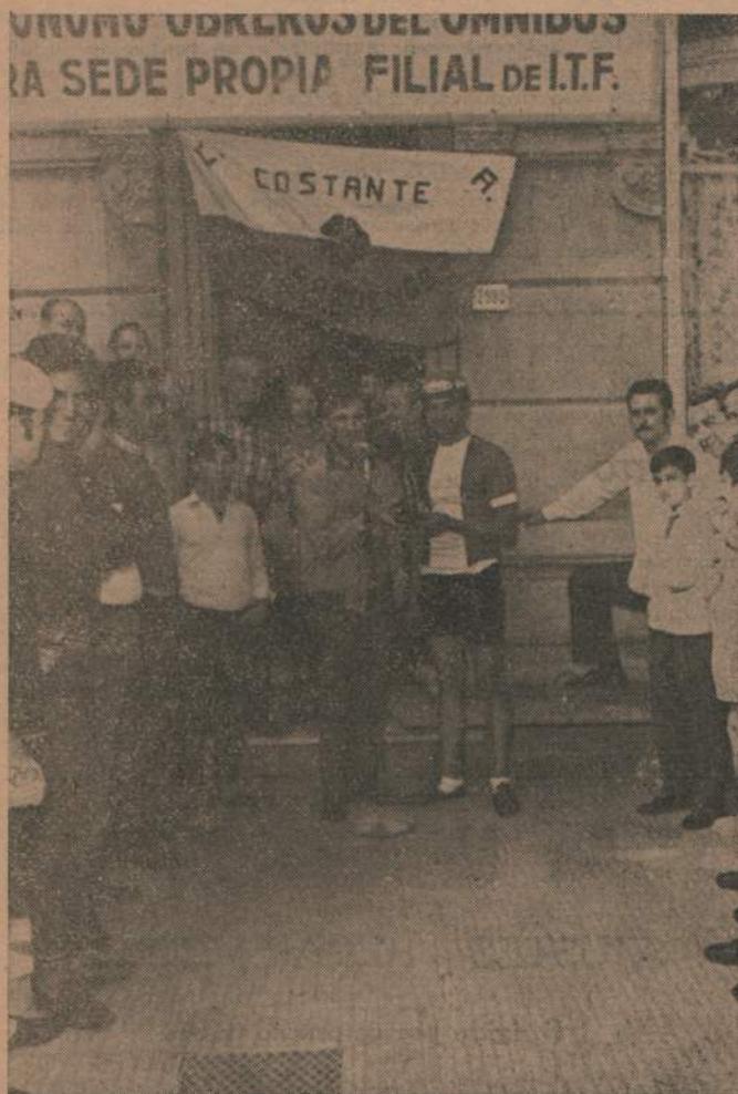
ENTREGA DEL PRIMER PREMIO "DOBLE CANELONES"

Señores!! No se olviden que los niños de HOY, son los conductores del Mundo de mañana.