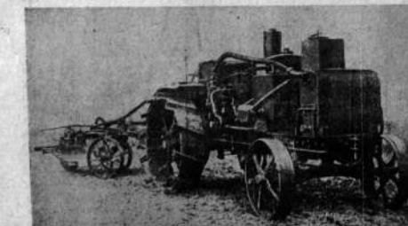
Tractor "Autogas". En este tipo de una fuerte proporción de hidrógeno que detiene los polvos, y medianeo, la que detiene los alquitranes.

La mezcla de óxido de carbono, hidrógeno y nitrógeno se denomina