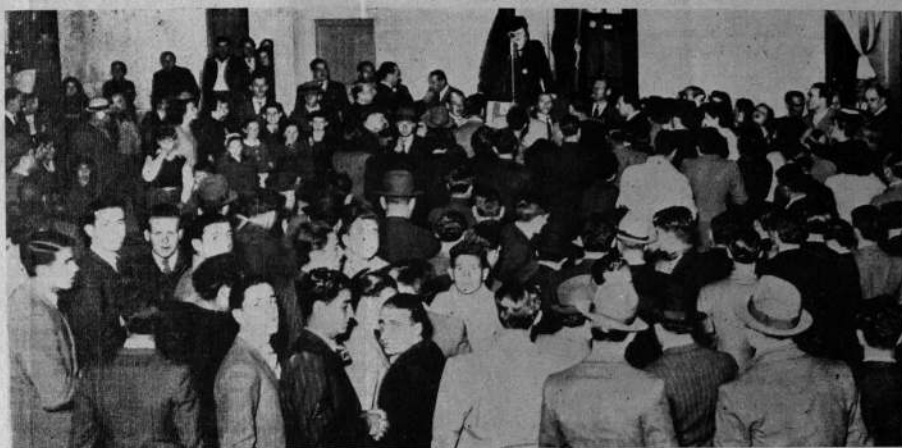
Aspecto parcial que ofrecía la vibrante asamblea patrocinada por la Concentración Dr. Gabriel Terra, verificada recientemente en Villa Muñoz.