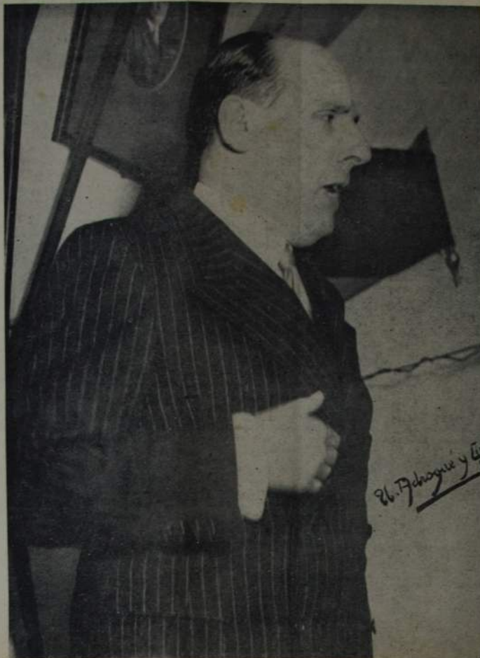
EL CANDIDATO DE LA "AGRUPACION POPULAR"