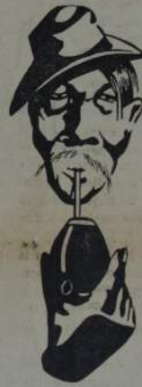
Verba -LA CERDA-