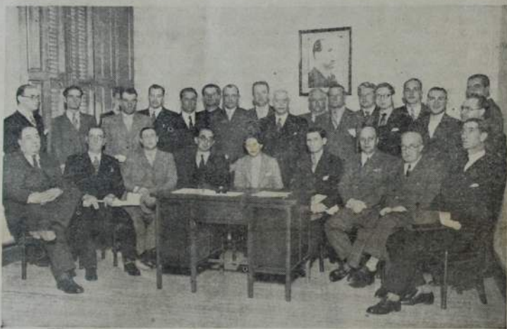
Delegación de la Concentración Colorada "Dr. Gabriel Terra", de Carmelo, en su reciente visita a la "Agrupación Popular"