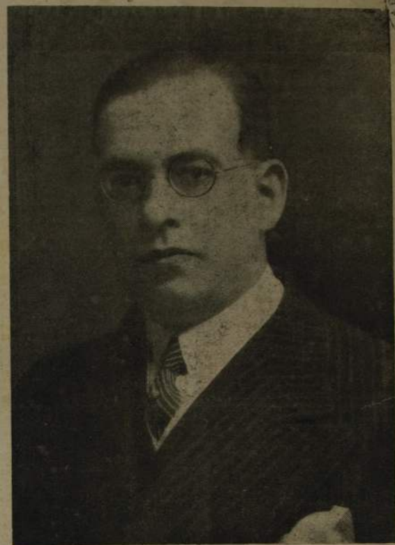
[Dinámico e inteligente Sub secretario de Salud Pública]