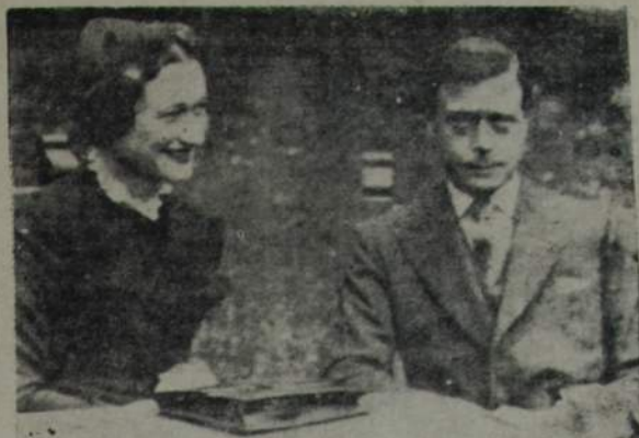
Por primera vez el DUQUE DE WINDSOR Y LA SEÑORA WARFIELD (ex Simpson) SE SEJAN FOTOGRAFIAR JUNTOS EN EL CASTILLO DE CAMPE. — El ex rey de Inglaterra, actual duque de Windsor, aparece junto a su esposa, la duquesa de Windsor, en una de sus partidas de golf, en la que practica el mencionado deporte.

Los beneficios sobre garantía de los alquileres se harán exten-