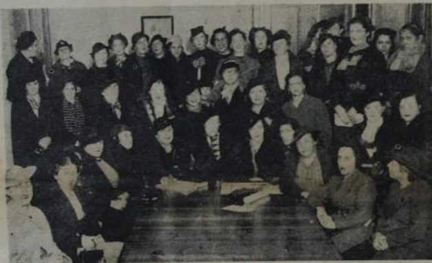
Una sesión del Comité Femenino de nuestra Agrupación.