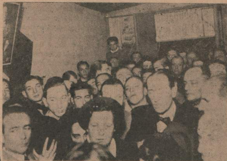
Parte de la concurrencia a la asamblea celebrada por el Club Daniel Blanco Acevedo de la 12 Sección

VIVA EL PARTIDO COLORADO! VIVA EL DOCTOR BLANCO ACEVEDO!