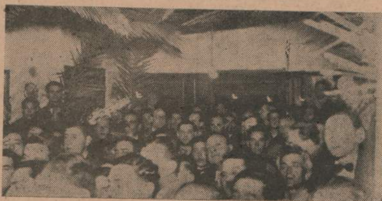
Una vista del público asistente a la reunión efectuada el sábado 7 en la Concentración Colorado Doctor Juan Carlos Blanco

CORRELIGIONARIOS: honda y grata emoción invade mi espíritu en estos momentos en que os dirijo mi modesta palabra, con motivo de la inauguración de esta entidad partidaria, que lleva por nombre, el de un pre-