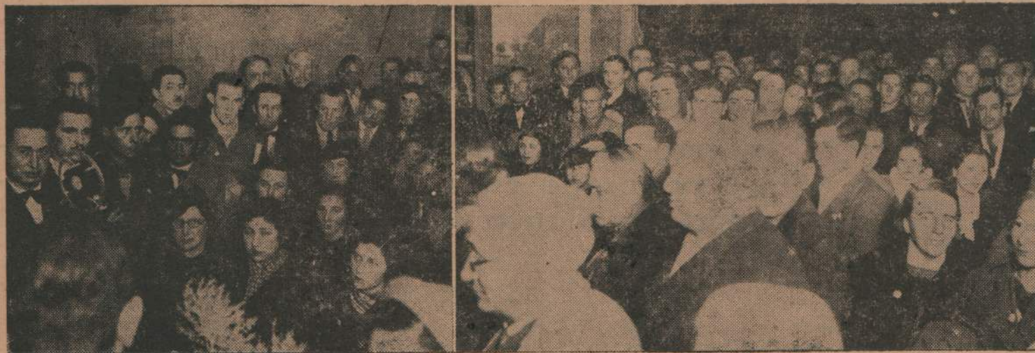
Parte de la enorme concurrencia que asistió a la asamblea realizada por el "Club Concentración Colorada de la 20 Sección Doctor Blanco Acevedo"