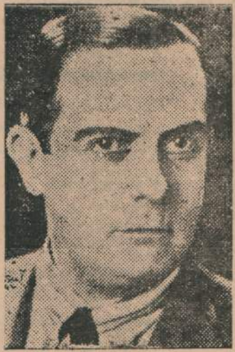
Dte. de la Administración del Puerto que realizó mejoras al personal