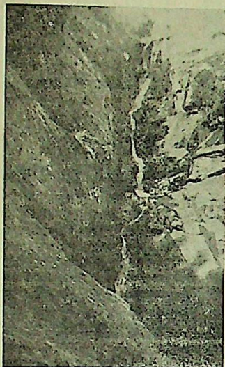
SALTO DEL AGUA. Penitente

Como consecuencia lógica de nuestras bellezas panorámicas, bien valoradas en toda la república y más allá de fronteras, cabe exhortar,