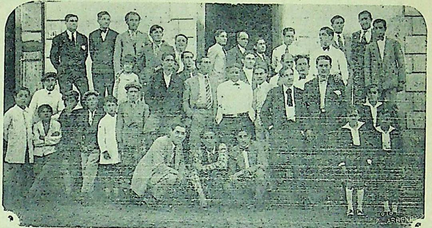
La Agrupación Coral Minuana—

Sólo la común, iluminará nuestras calles.