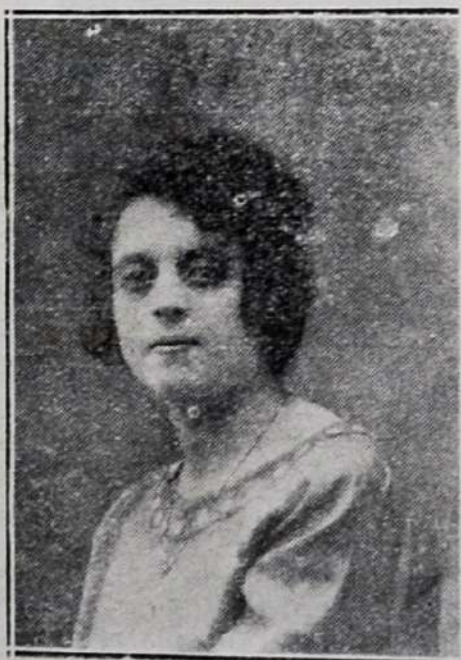
Sta. Isabel Bia