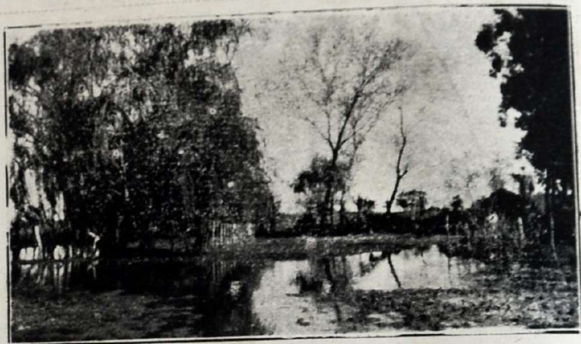
Uno de los bellos aspectos del Tala