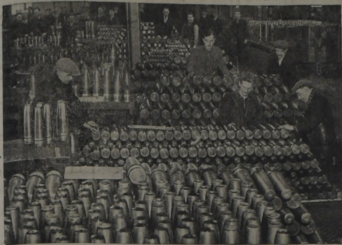
Las municiones de Gran Bretaña aumentando cada vez más. Todos los días se aumenta más, para recibir la fuerza nazi con más fuerza.

Cada día que pasa el "eje" pierde una oportunidad