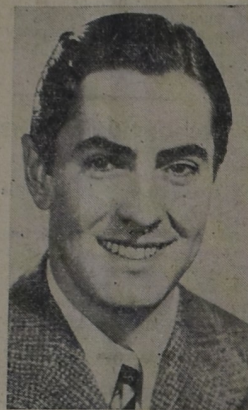
Vuelve a la pantalla del «Atenas» en esta semana, el Gran Tyrone Power!

2da. sección: 2th C. Fox presenta la extraordinaria película dramática titulada: «La Llamada de Media Noche». El conocido actor Brian Donley de gran actuación en «La Batalla de Broadway», «Su alteza en peligro», «El as del acelerador», etc., vuelve encarnando el papel protagónico de esta emotiva producción que llegará al espíritu del espectador.