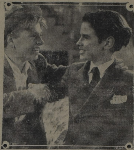
Culminante escena de «Los Hombres no Lloran» que protagonizan Mickey Rooney, y Ronald Sinclair a quienes vemos sonrientes, camaradas y optimistas. La figura juvenil de Judy Garland encarna la acción femenina del film y los tres deleitarán el miércoles a la hinchada nacionalófila que concurrirá a homenajear al club de sus amores al Cine «Atenas»