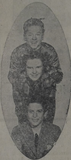
He aquí al famoso trío: Mickey Rooney, Judy Garland y Ronald Sinclair, que pasan hoy por el Cine «Atenas»

En una historia conmovedora y dramática se desarrolló un drama que cautiva, en el fondo de las noches misteriosas, llenas de silencios impresionantes, en el cual los personajes de aquella cacería sufrieron mil inconvenientes, debiendo luchar con las fieras y la maléfica naturaleza de embrujo salvaje.