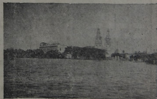
Iglesia San Ramón y Colegio "Don Bosco" surgen de un mar de agua dulce