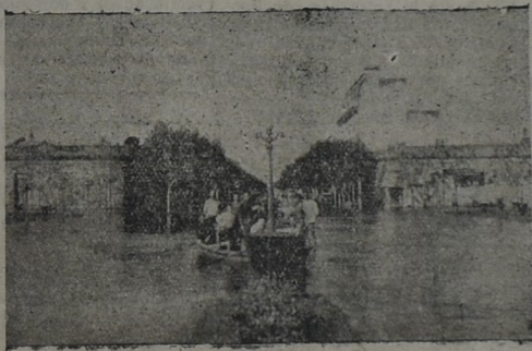
La Avenida Brasil vista desde la Plaza Colón

hípicas se nota gran entusiasmo, llegando muchos aficionados del interior del departamento y de Soriano, habiéndose concertado otras carreras de crecidas apuestas.