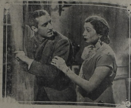
De la Película «A Puertas Cerradas», que protagonizan Basil Rathbone y Aline MacMahon con sus emocionantes interpretaciones.

Soldadura de cualquier pieza en hierro, bronce, cobre, aluminio, etc.