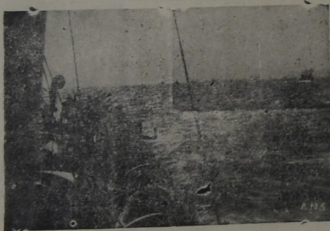
Un convoy mercante británico navega en el Canal de la Mancha, vemos en esta foto tomada de una "Globe" de escolta recientemente construida.