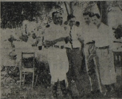
Presidente Honorario de la Sdad. Rural de R. Negro