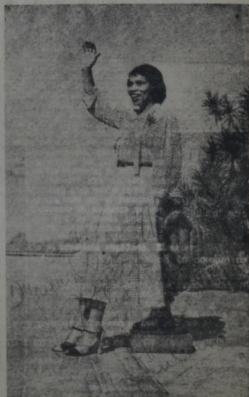
ES UN VALOR QUE APARECE CADA SIGLO, HAY QUE INCARSE DE RODILLAS PARA ESCUCARLO, DUDO TOSCANINI