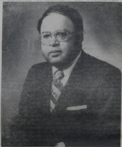
DIPUTADO CHARLES C. DIGGS, HIJO. ES UN POLITICO MUY CONOCIDO EN E.E.U.U. POR SU TRAYEC- TORIA INTELIGENTE.