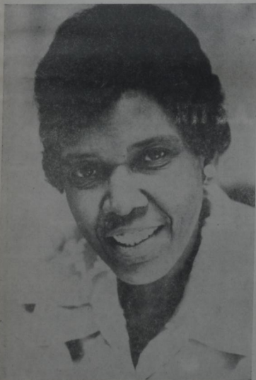
CONGRESISTA... Dra. Bárbara Jordan, destacada intérprete de Justiniano, está considerada como una de las oradoras más apabulladoras, tanto dentro del sexo femenino como masculino. Cuando se inició el proceso al expresidente Nixon esta formidable mujer pulverizó cuanto alegato se presentó en defensa de aquél. Es una mujer bien madura. Bien se argumenta que no en la belleza física donde está la inteligencia que sirve de paradigma.