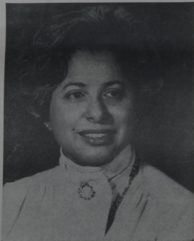
MINISTRA... DRA. PATRICIA R. HARRIS, SECRETARIA PARA VIVIENDA Y DESARROLLO URBANO EN SUDAMERICA SE DAN CASOS DE CIUDADANOS QUE SON LLEVADOS A DESEMPEÑAR LAS MAS ALTAS DIGNIDADES SIN TENER UNA CULTURA MEDIANAMENTE SUPERIOR, ANTES BIEN, RUDIMENTARIA, PERO EN EE. UU. UNA PERSONA ES DESTINADA A UNA FUNCION DE TRASCENDENCIA MINISTERIAL, ES PORQUE SU CABEZA TIENE QUILATES.