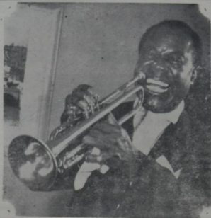
LOUIS ARMSTRONG. ARTIFICE QUE MERECIO EL PANEGIRICO DE LAS MULTITUDES MULTINACIONALES. DE SU INSTRUMENTO EMERGIAN NOTAS QUE NOS HACIAN TRANSPORTAR FUERA DE SI... LA VIBRACION DE SU CORAZON SE ESTREMECIO Y PERDIO...