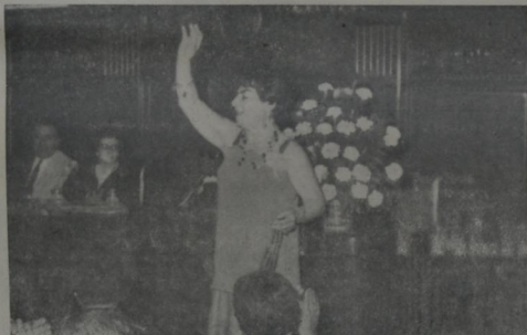
EUFORICA Y REBOSANTE DE ALEGRÍA ARTÍSTICA, SALUDA A LA CONCURRENCIA.