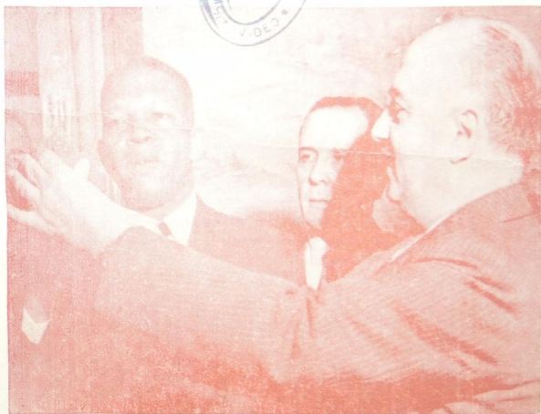
La personalidad de color - HULAN IACKS - que muestra la nota gráfica, es el Vice - Prefecto de New York, electo el día 5 de Noviembre de 1957, acompañado por el Cónsul General del Brasil ante el Gobierno Americano, junto a otra eminencia.