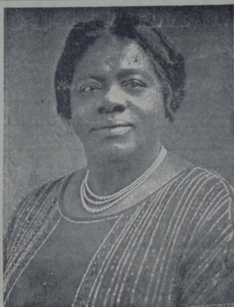
Dra. MARY MCLOD BESTHUNE...

Esta maravillosa cabeza fue miembro de la Comisión de Educación de Nueva York.