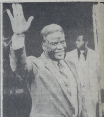
ALCALDE DE CHICAGO

El área musical afroamericana tiene un fondo común, el encuentro de la música africana y europea. Y pide disculpas por los errores que pueda haber cometido. Cita al Uruguay en dos oportunidades pero no está bien informado sobre la música negra de nuestro país y el fenómeno candombe que nació junto con la llegada de los esclavos a estas playas. En su extensa bibliografía cita a Néstor Ortiz Oderigo que ha dedicado su vida al tema pero en una obra en inglés. Del Uruguay no cita ningún autor. En el año 1944 Ortiz Oderigo editó en la editorial Claridad de Buenos Aires su PANORAMA DE LA MUSICA AFROAMERICANA dedicada a la música negra de los Estados Unidos con fragmentos poéticos: canciones de trabajo, espirituales, baladas, folk blues o blues folklóricos, race blues o blues populares con una extensa bibliografía, discografía, filmografía e índice de nombres citados.