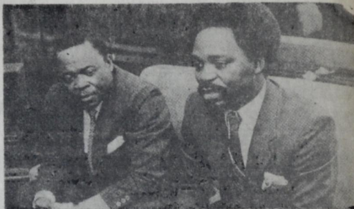
AFRICA... REPRESENTANTES GABONESES LLEGARON POR POSIBLE INTERCAMBIO