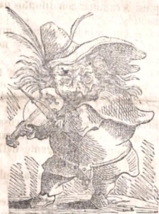
Al que le caiga el sayo que se lo ponga.

Ahora digo yo. ¿Quién tiene la culpa de esto?—(Nada me importa saberlo)—pero casi estoy por creerlo—que es el jefe de la fiesta. Aun que muy bien puede ser—que el su orden haya dado—y la mosca no ha alcanzado—para faroles encender.—Y es ridículo por Dios—y ridículo al extremo—pues hay un jefe supremo—y el de la fiesta, son dos.—Son cuatro ojos, mas un lente—(este es el del Delegado)—que pudieron divisar—la tal falta de alumbrado.—Tal vez ni él se acordó—del citado aniversario.—Mas Comenzon se fijó—y el público contempló—en él al debil Erario.—El público no transije—señor con estos desdichos—¿pues estamos divertidos?—tan poca cosa se exige—á los jefes referidos.—Sirva de regla también—para de hoy en adelante—y á nuestro jefe galante—Dios le dé memoria—Amen. Comenzon.