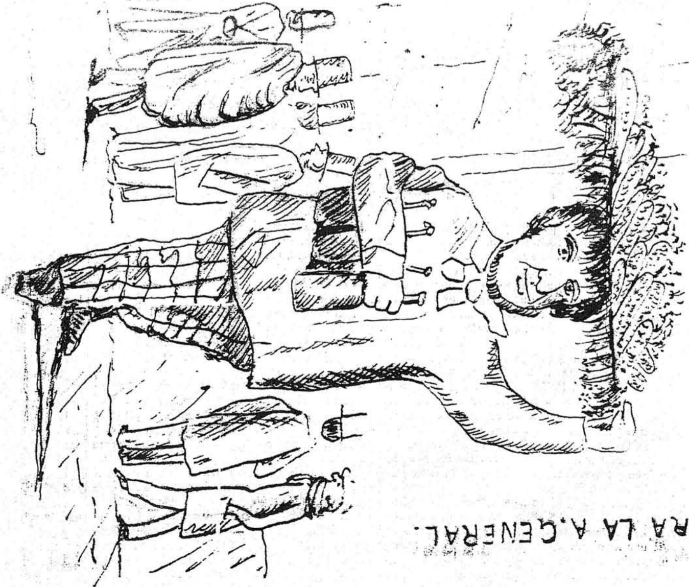
PARA LA A. GENERAL.