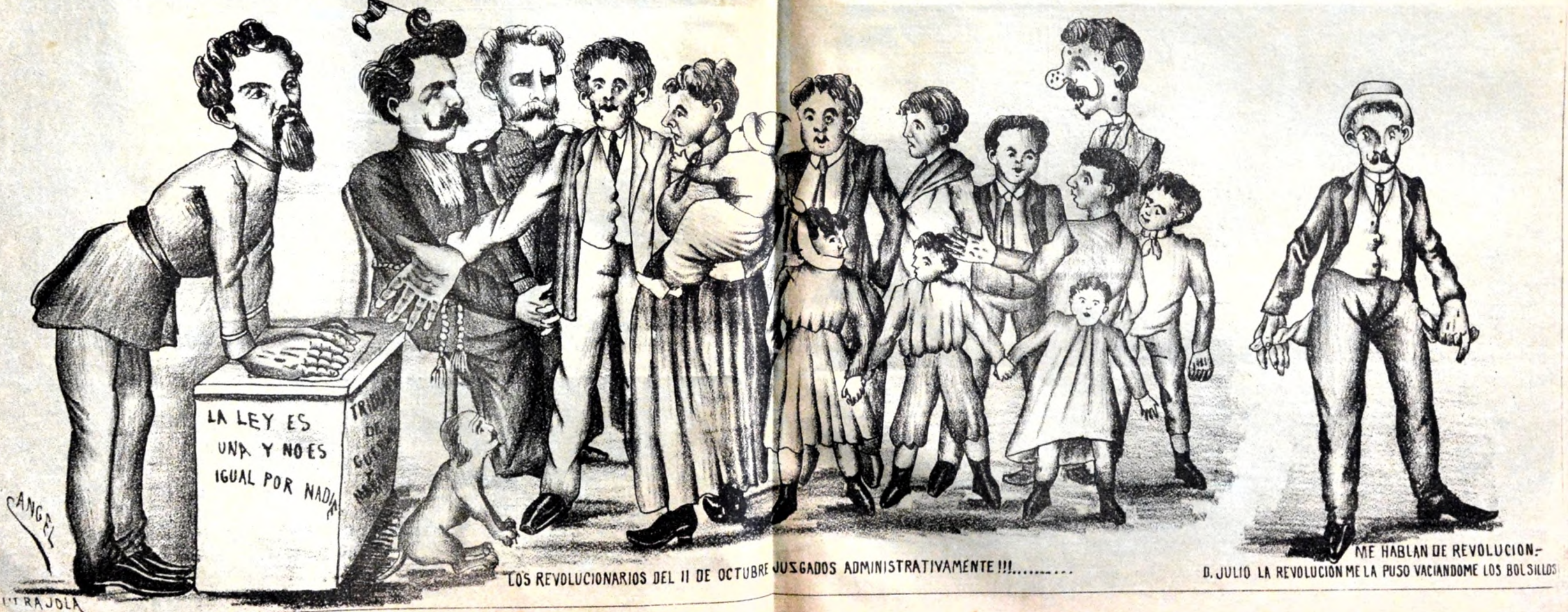
LOS REVOLUCIONARIOS DEL 11 DE OCTUBRE JUGADOS ADMINISTRATIVAMENTE !!!.....