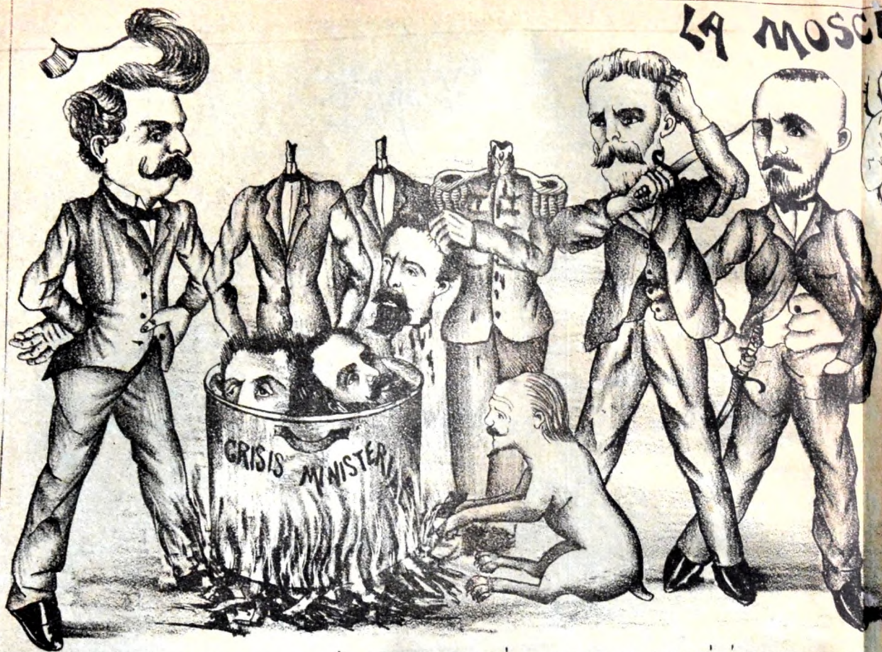
CUANDO TODOS ELLOS SE LA HABRÁN CORTADO HABRÁ QUIEN ME LA CORTARÁ A MI TAMBIEN