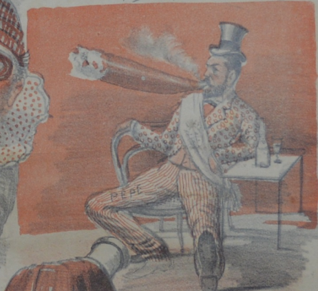
Como primer magistrado salió muy bien retratado.