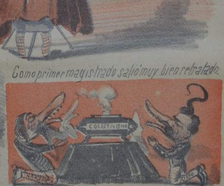
Van llorando amargamente el pasado y el presente