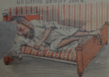
Es menester descansar si fué rudo el trabajar. ADMINISTRACIÓN JUNCAL 768 (Plaza Indep.)