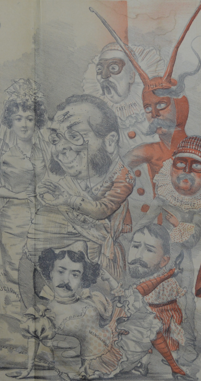
Con bombas y con fogatas se casó el Torero Cuestas, y con ruido de latas Al fin se acabó la fiesta.