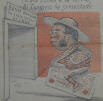
Al "Banco" nació "Mal" Cuesta llevó su caudal Pues cuando mucho se cobra Un nichito siempre sobra.