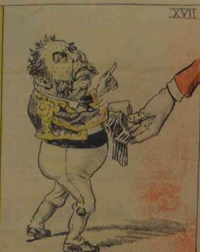
Don Juan, después de muchos titubeos prefiere a Pepe a quien entrega la banda