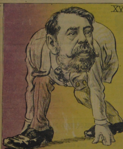
Y el gigante Pepe...