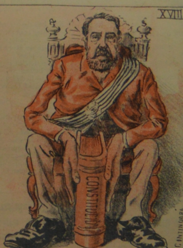
Confiado que con su fuerza hercúlea sabrá cuidar la bien y en efecto...