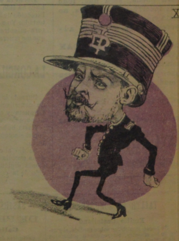
Y el petiso Rufino...