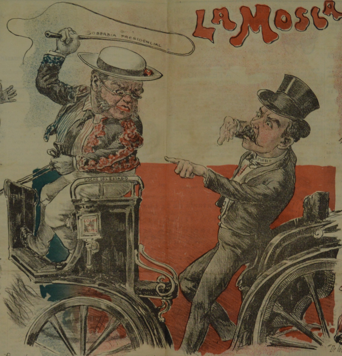
Porque el amo, buenamente, un nuevo rumbo le indica para ir al agua corriente, el cochero impertinente en su soberbia se pica Y brutal, así replica.