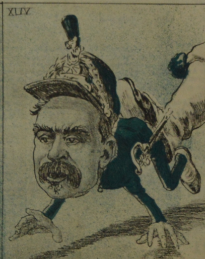
Protesta en vista de una pedicula.