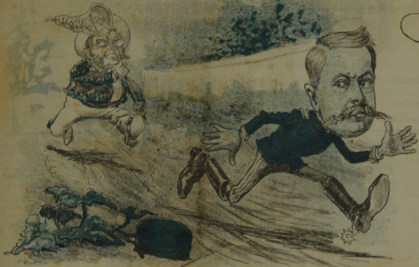
Por Santiago del Estero se escapó Buist del primero.