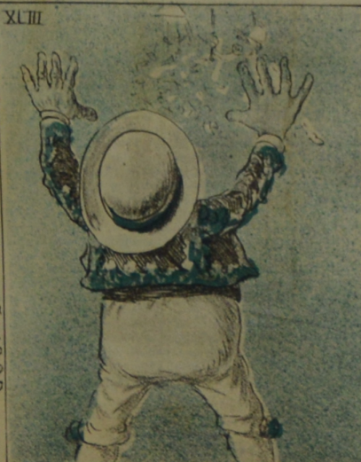
Cuestas que crece lento al pueblo, pero nunca llega para darle duche.