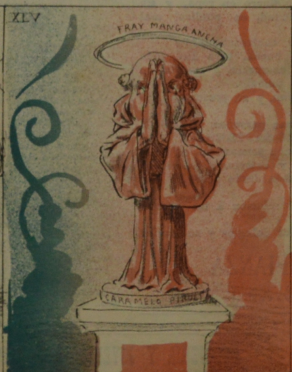
Y por de Jefe fidio a Acosta y Lara, que por la benigna y sumiso se convierte en Santo.