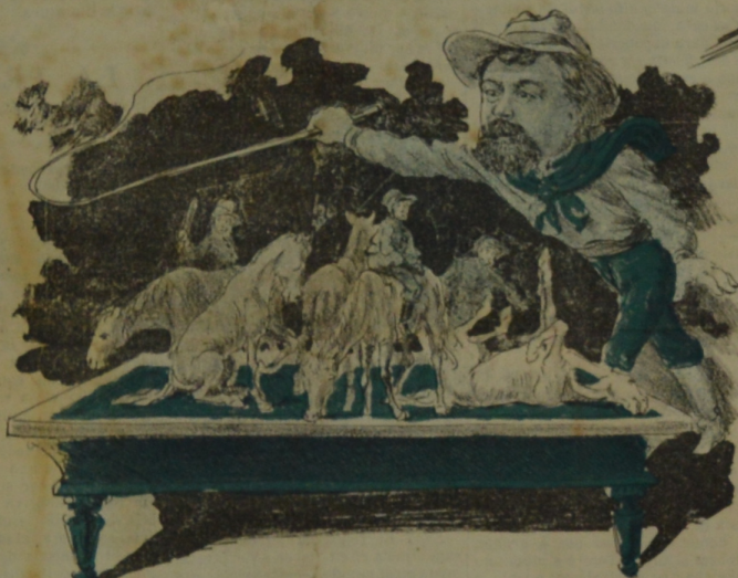
A viva fuerza invadido fué el Billar del general Y a la verdad que el partido que pegaron fué muy mal.