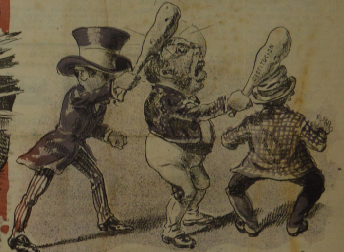
De los muchachos el juego hace Cuesta con su mano. Pues Hernandez dice: Pego Y Cuestas pega al hermano.