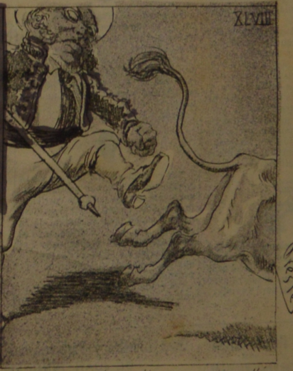
En otro arrebató parálisis... rativo alla so van los temas.