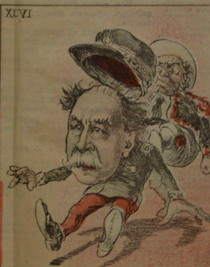
Quizás, para curar la parálisis, Cuesta estira otra vez la pata.