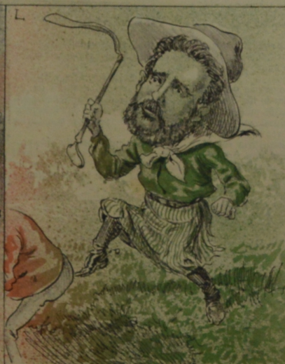
El cual, para variar, la emprendió á patadas con el directorio nacionalista.