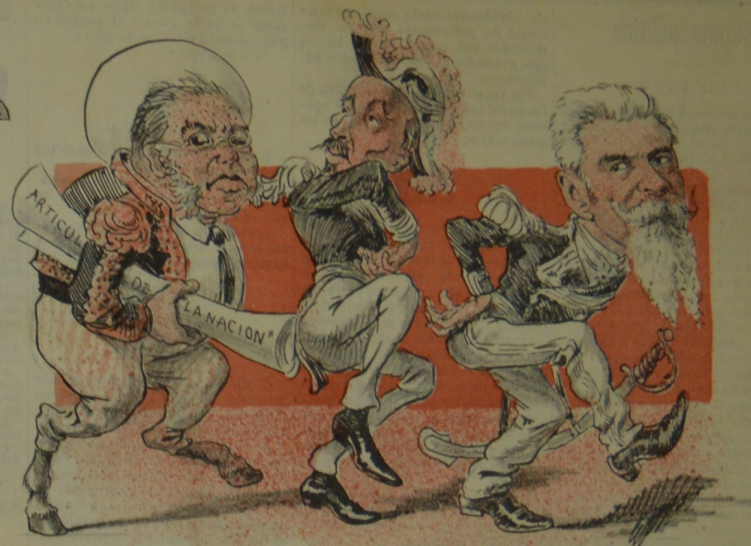
Como buenicadero, con pica de pergamino, lastimar quiere el Torero a Navaja y á Maximino.