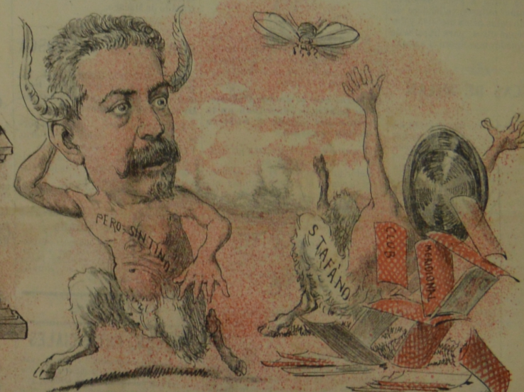
A causa de una Mosca impertinente, se asustaron Galeno y Presidente, Y luego de gran fuerza haciendo brillo, derrumbaron de naipes el castillo.