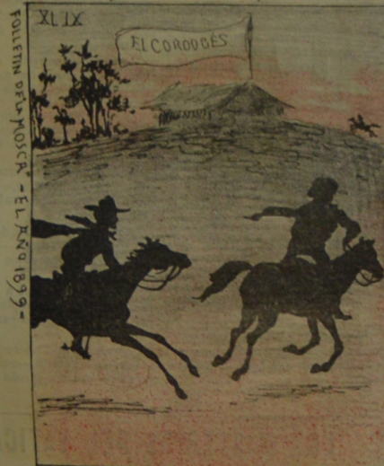
Formado este ambiente pateador, alguno metió la pata en la estancia del presidente número 2.