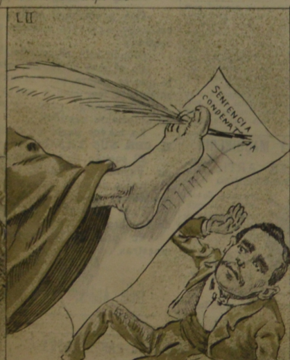
Y puesto en moda así el ejercicio patuno, hasta la Justicia vino á razonar con la pata.