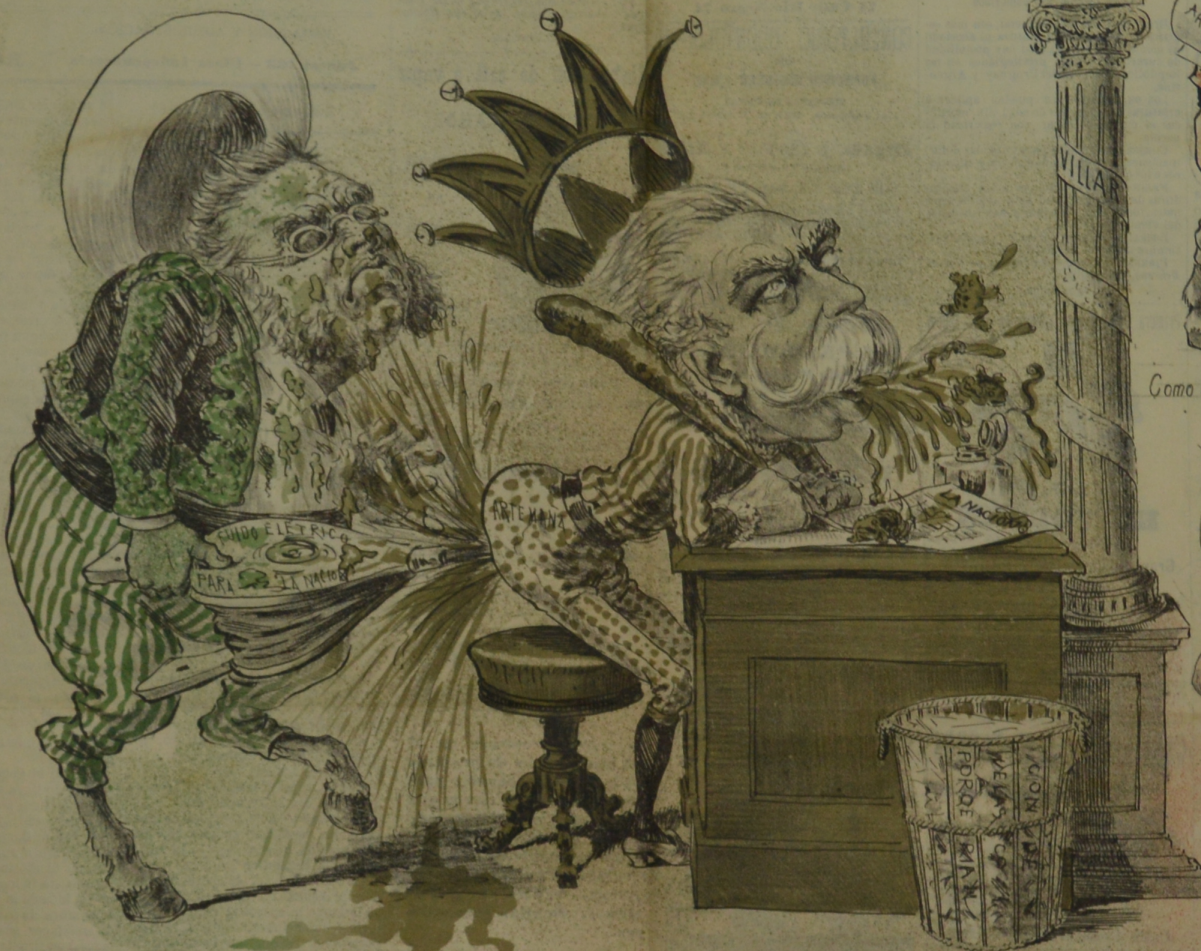
Con tal furia soplo y con tanta fuerza, que el humo le salió por la culata, pues que no llega á salpicar la estatua, Y con su misma polvora se empuerca.