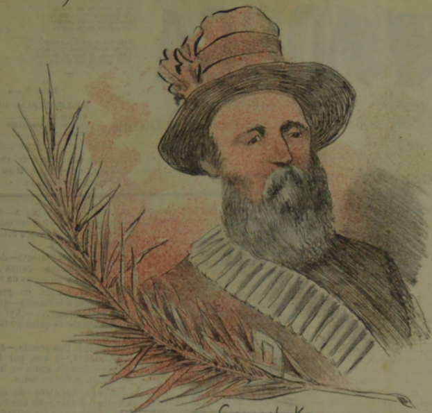
General KRONJE (del ejército Boer.)