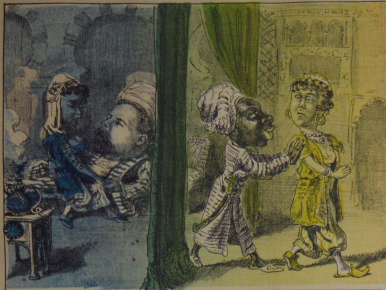
Cosa rara é inaudita echar á esta dama fuera, si el publico no supiera Que vale la favorita.