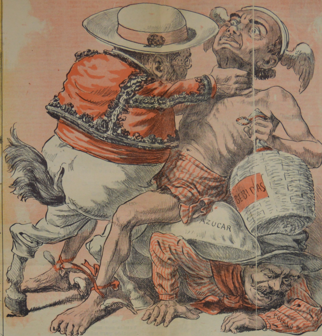
Será el pueblo pagano lo que siempre paga el pato Si le recargan la mano ó le apretan el zapato.