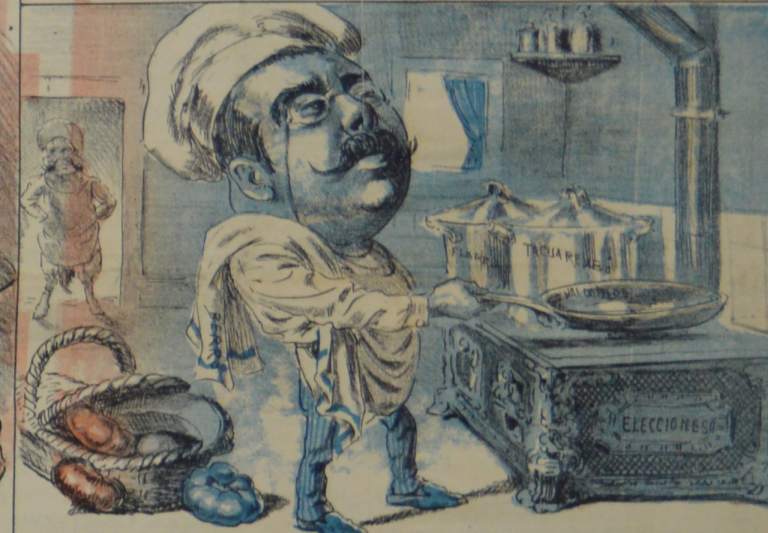
Con orden y disciplina marcha la blanca cocina.