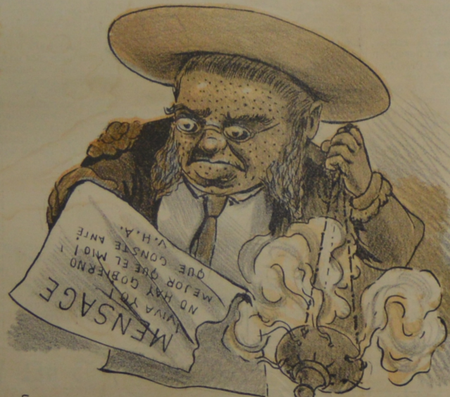
Envia con mucho coraje del deficit el mensaje.