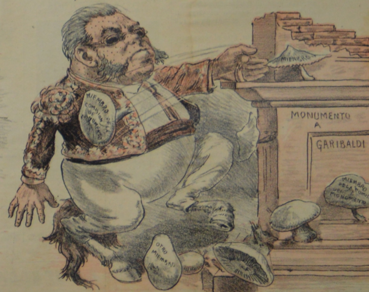
No siempre han de ser patadas las patadas de este tal. Puesto que gana con estas el aplauso general.