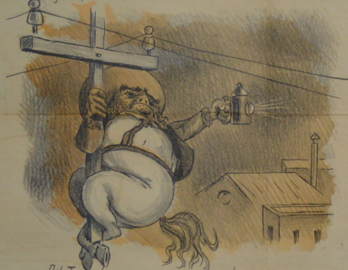
Del Torero la pavura se parece a una locura.