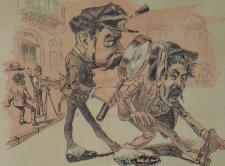
Para prender algun misto hoy se practica el registro.