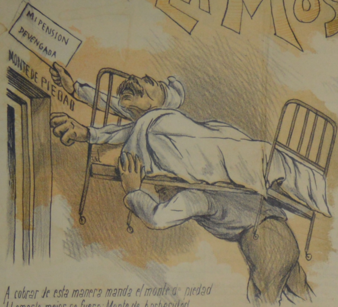
A cobrar de esta manera manda el monte de piedad. Llamarlo mejor no fuera: Monte de barbaridad.