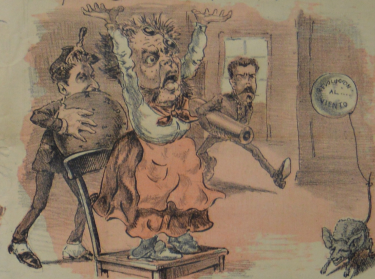
Fue para Cuesta un mal parto la sublevacion del cuerno.