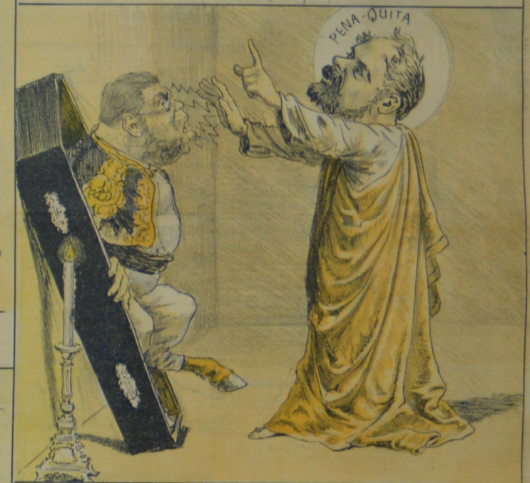
Estaba ya medio muerto, pero vino el nuevo Cristo, quien de un manotazo esperto. Lo hizo levantar muy listo.