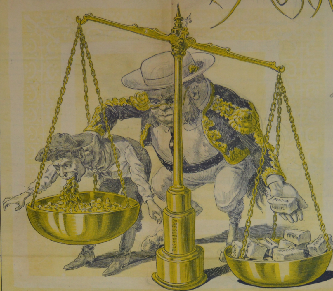
De un lado carga en exceso y por contrabalancear. Aprieta, aprieta el pescuezo hasta hacerlo reventar.