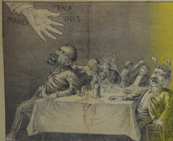
Cuando ya iba á empujar el festin de Baltasar. Una mano misteriosa hizo ir en humo la cosa.