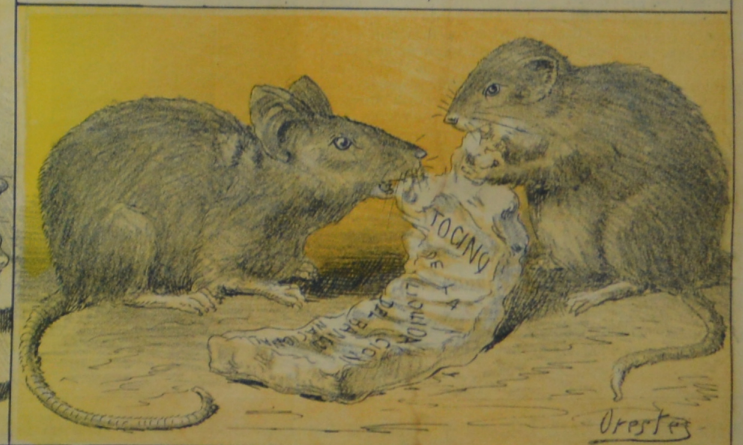
Nos alegramos de veras viendo lo que pasa acá. Puesto que de esa manera mas pronto se acabará.