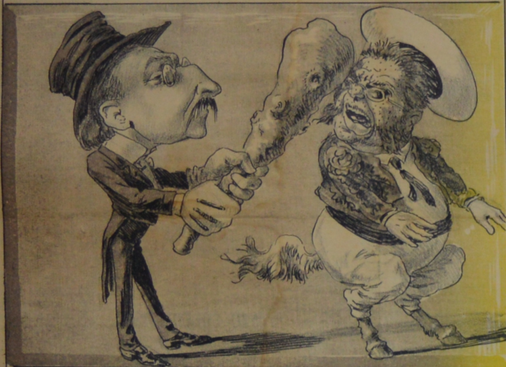
Muy correcto, á lo decente este tipo original le da al bestial Presidente. Un macanazo bestial.