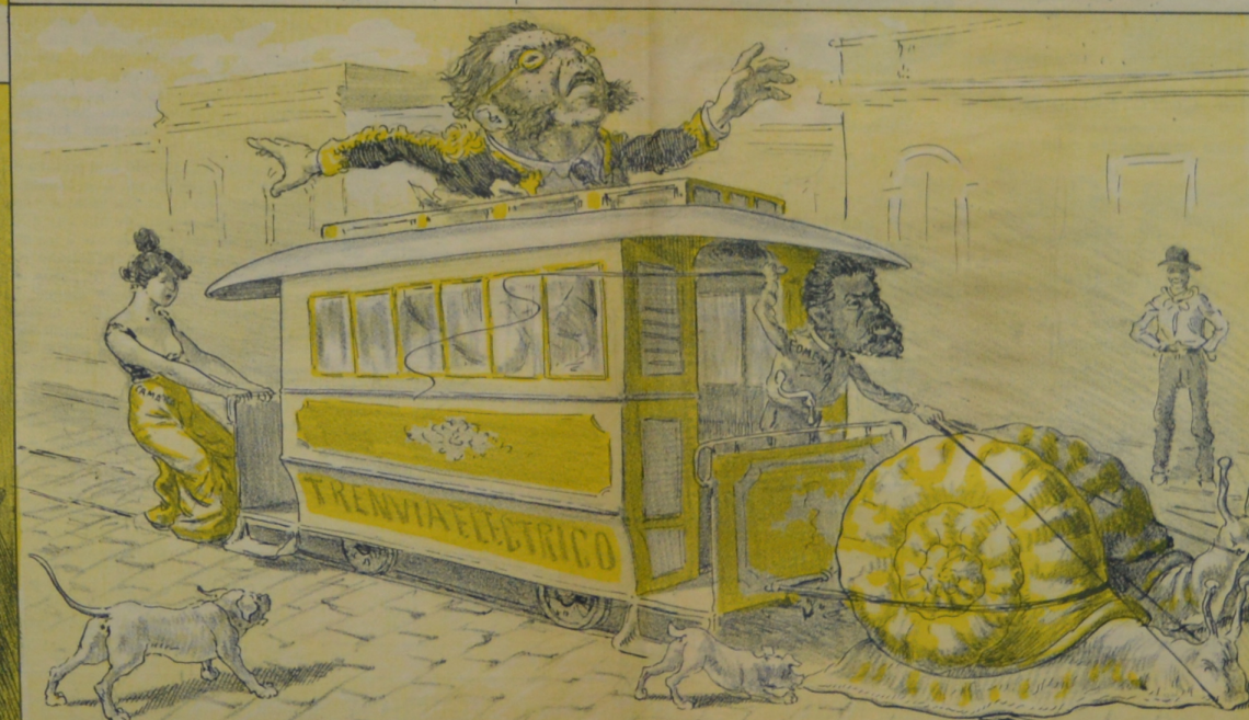
Si es tan rapido en marchar, como es lento en el venir, dios nos libres de chocar con él en el porvenir.