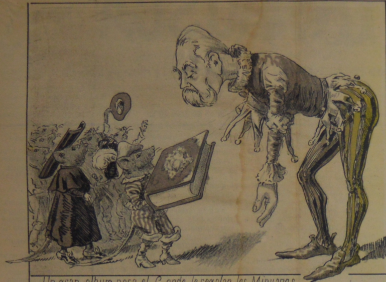
Un gran album para el Conde le regalan los Minueros. Esto indicara hasta donde se premian las limpias manos.