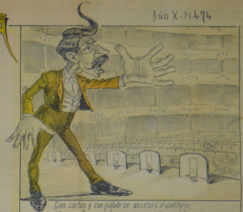
Con cartas y con palabras asustará el auditorio. Mas su afan será ilusorio, pues predicará á las cabras.