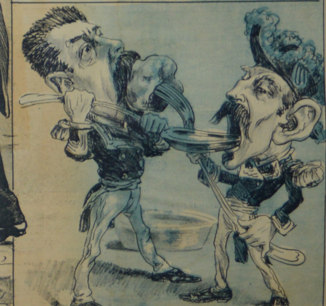
Conferenciando los dos sordos-mudos Del Torero comieranse el engrudo.