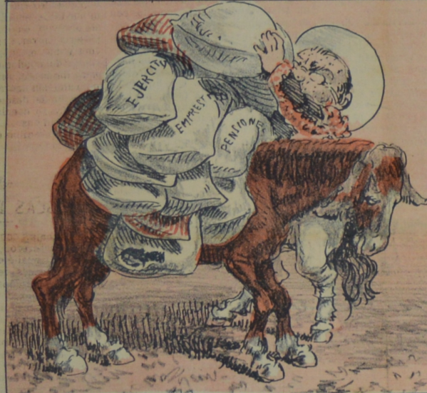
Van los pensionistas a sueldo íntegro Y el burro va cargado como negro.