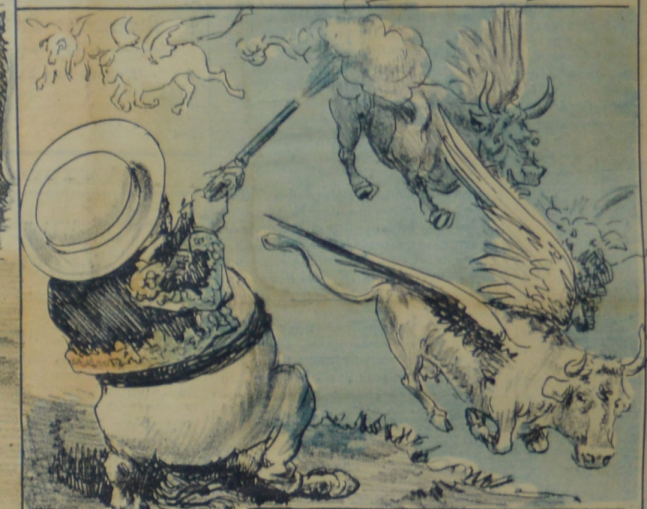
El cazador contra la fiebre aftosa Dispara al vuelo el arma belicosa.