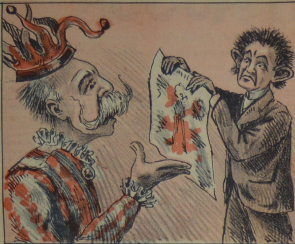
No estando mi retrato en "La Mosca" Te doy una patada y no la rosca