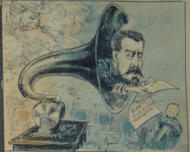
La interpelación de Pereda aborda En este modo el general Can-gorda