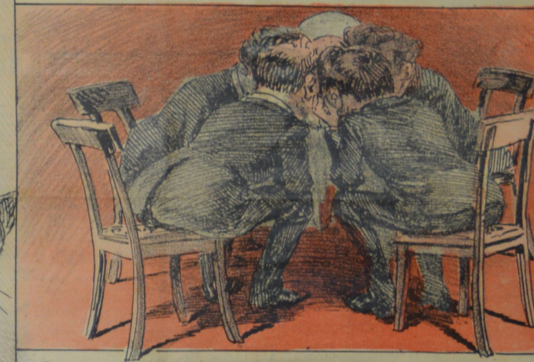
Para afirmar del Torero el imperio se reunieron algunos con misterio.