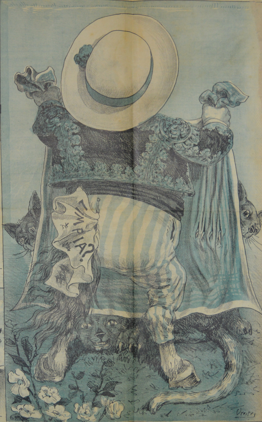
Para que no le apreten el zapato en la isla de Flores oculta el gato.