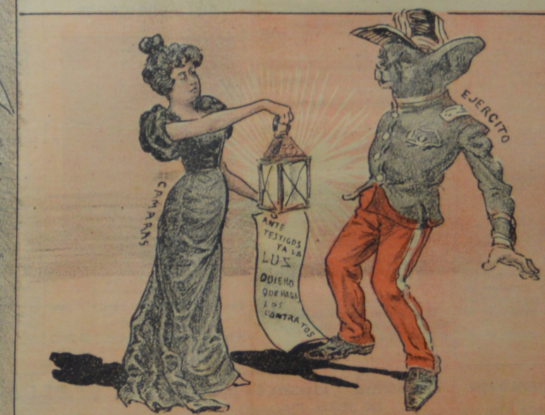
En busca de involuntarios, alumbraré el escenario.