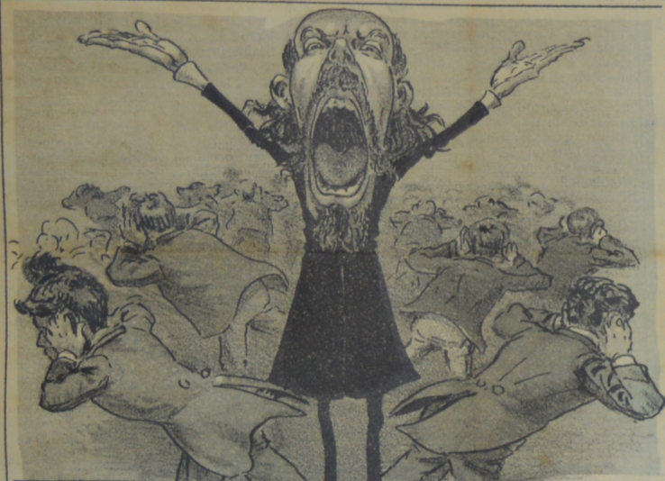
Habló el latero, y al instante, por no sufrir un chorizo De su oratoria brillante, aceptaron lo que quiso.