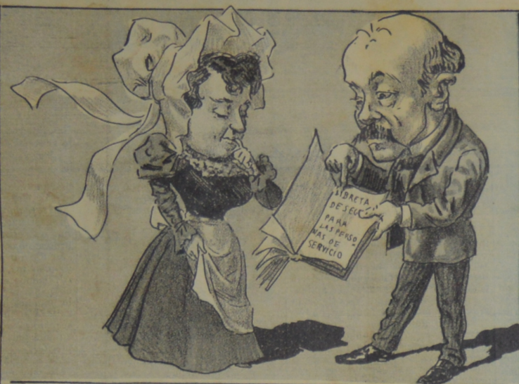
¿Cómo se entiende, amiguita, ama de leche y soltera? Y aquí ni una falta cita? Es que el libro, que es zonzoso, me lo dio una compañera.