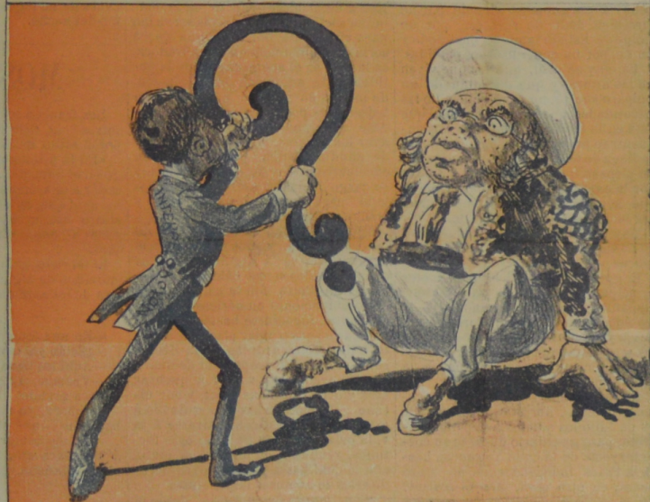
¿En donde habrá puesto el pico el ministro Cuesta chico.