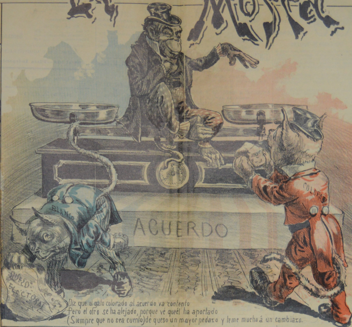
Diz que el gato colorado al acuerdo va contento Pero el otro se ha alejado, porque vé queél ha aportado (Siempre que no sea cuento) de queso un mayor pedazo y leme mucho á un cambiazo.