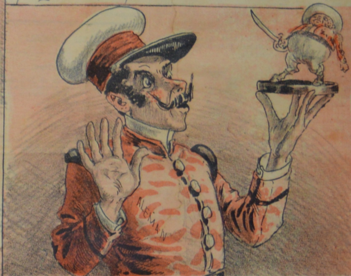
En la lejana Alemania fulgura del Torero la facha y la figura.