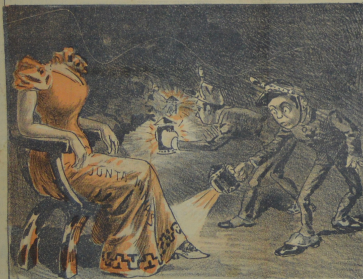
Se busca con estrañeza de la Junta la cabeza