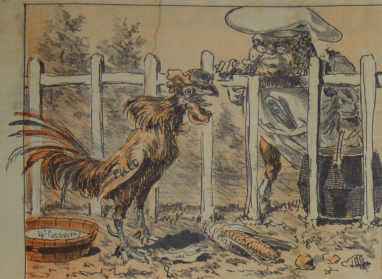
Ten mucho juicio muchacho porque pronto iras al tacho