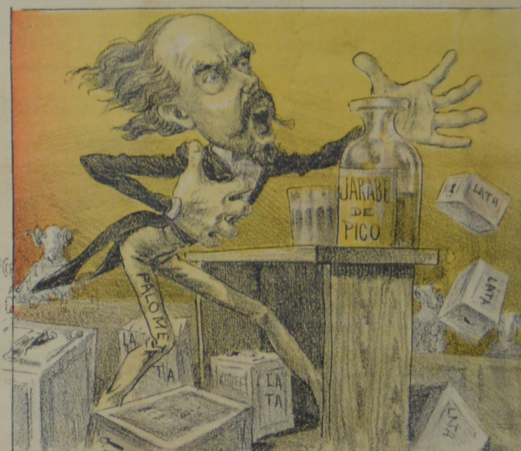
Largó la lata contra los breros, pero nada sacó con sus roderos