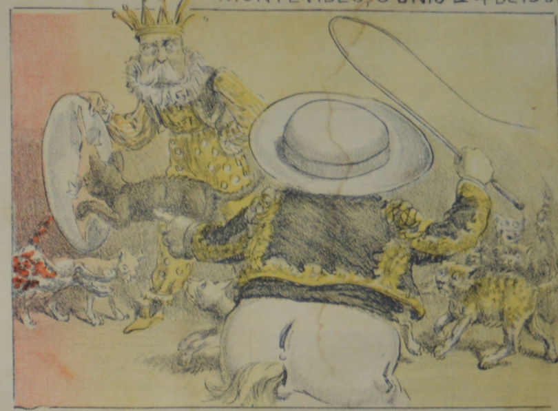
De la influencia directrix resultó un habil aprendiz