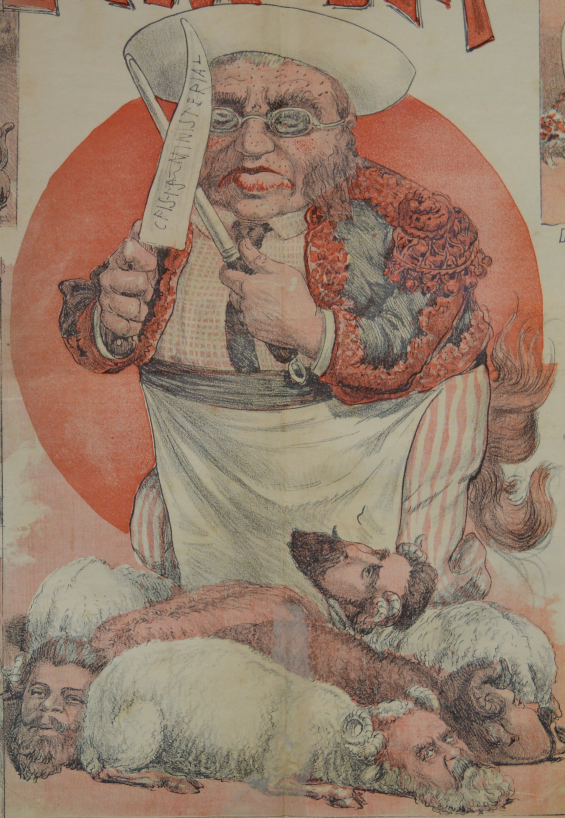
La cuchilla prepara el gran Torero para sacrificar estos carneros