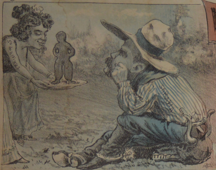
Porque se lo comiera de un liron Regalaronle un gran Napoleon.