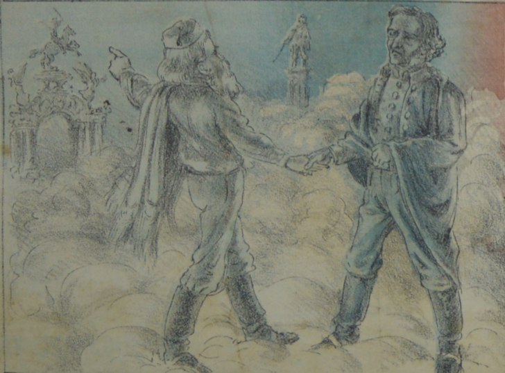
Surgirá el monumento en esta era de Artigas y del Leon de Capreza