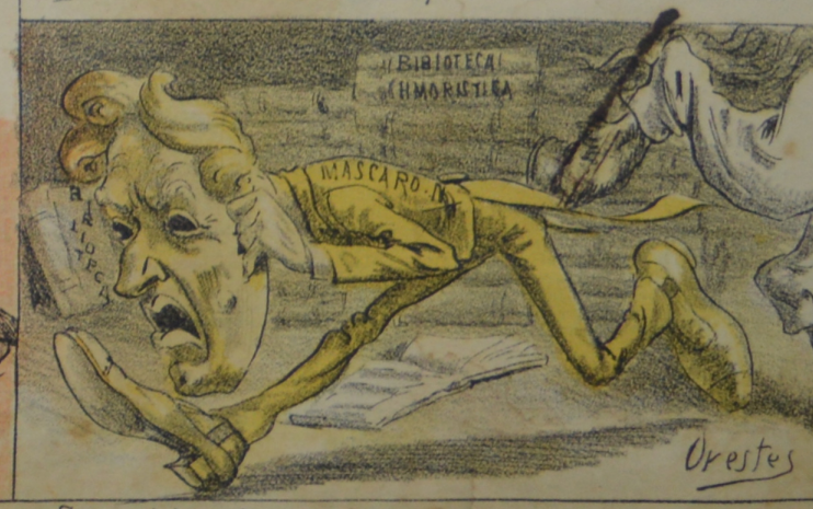
Preparó la pala y con fuerza atroz Largó al Mascaron tremenda coz