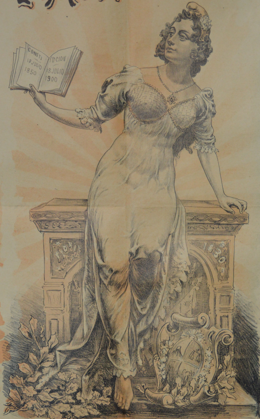
LA JURA DE LA CONSTITUCION 18 DE JULIO DE 1830