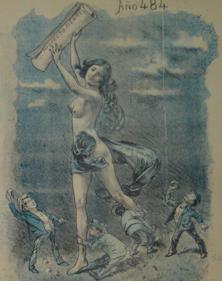
Son tan bajos y mezquinos los que le cierran el paso Que ella sin hacerle caso, sigue su triunfal camino.