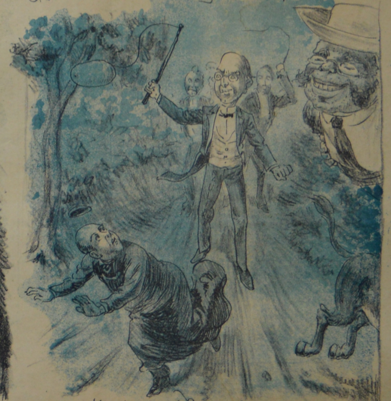
Viendo entrar a Paulier el negro mundo Va disparando con dolor profundo.