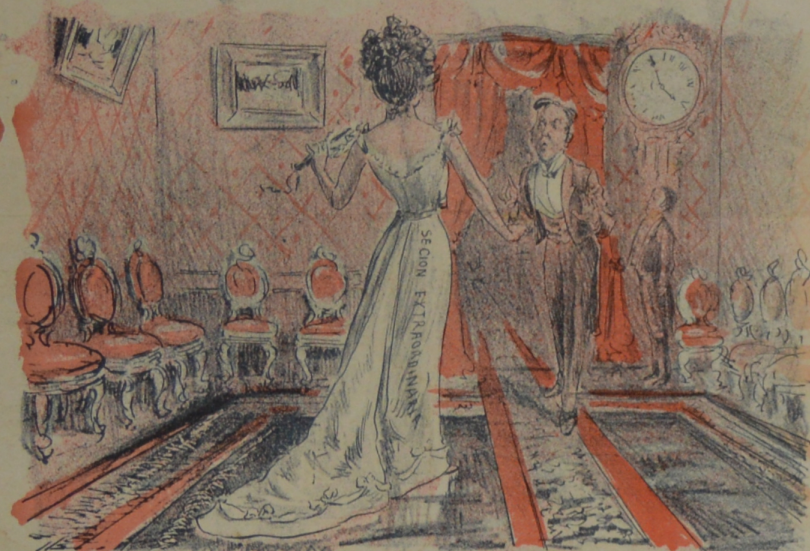
Se pidió por 15 días mas la prolongación de la sesión de la Cámara pero los legisladores cobran y no concurren.