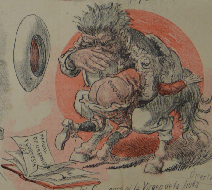
No lo librara del C...erro ni la Virgen de la Luján A cualquier hombre o perro que el Torero no saluda.