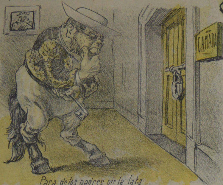
Para de los padres oír la lata De abrir Senado y Cámara hoy trata.