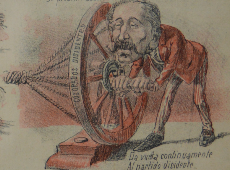
Da vueltas continuamente Al partido disidente.