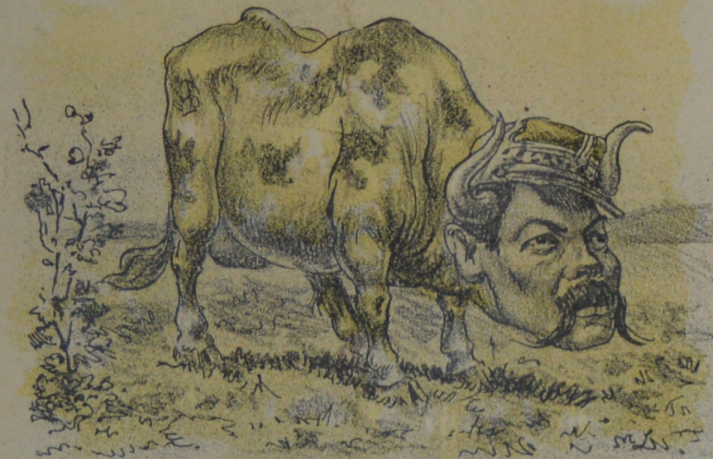
Al pastoreo y al ganado Café Frio se ha dedicado.