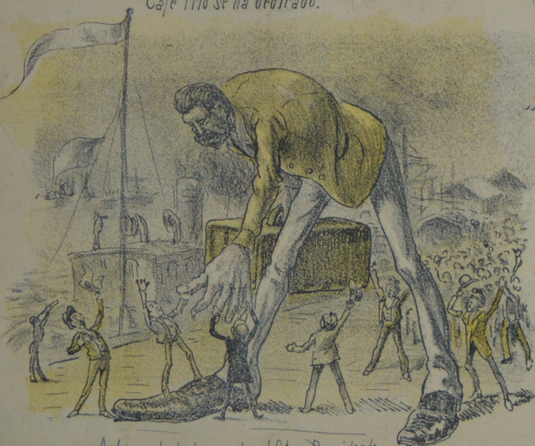
Aclama toda la gente al fútem Presidente