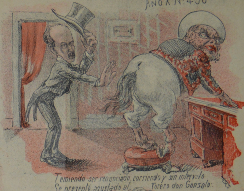
Temiendo ser renunciado, corriendo y sin intervalo Se presentó asustado al Torero don Gonzalo.