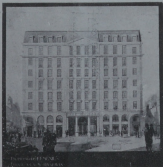
Esto es el hermoso edificio que ocupará la Editorial de la interesante revista argentina "Femenil", que con tantos lectores cuenta, tanto en su país como en el extranjero.