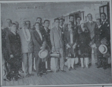
Delegación de periodistas brasileños llegada recientemente a nuestro país en misión de estudio