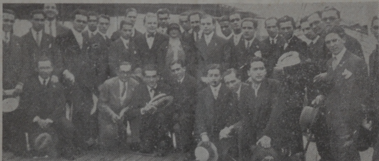
Estudiantes de medicina

Ha llegado a nuestra metrópoli la caravana médica brasileña, la que, como dice uno de sus ilustres componentes "vienen envueltos en una amplia bandera de paz, y juramentados a luchar por un alto ideal de felicidad y de confraternidad".