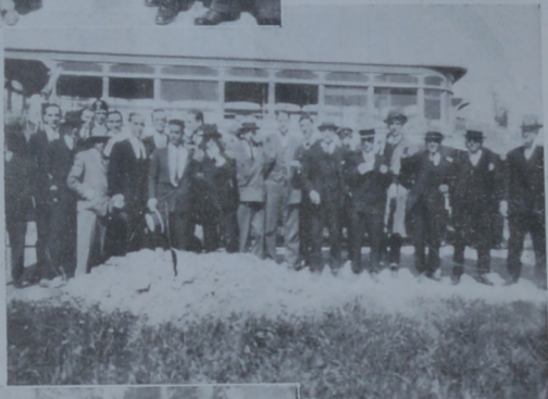
Los del Hipotecario haciendo un alto en la carretera a San José