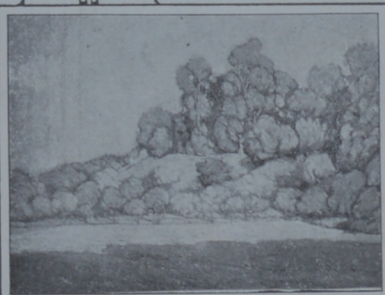
"Sol de tarde"

Los problemas difíciles, donde tropieza con inconvenientes la técnica del artista saben encontrar en Malinverno el ejecutante de pinceladas ágiles y seguras que allanan el obstáculo.