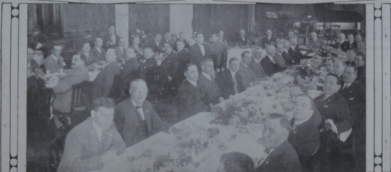
Vista general del banquete con que fueron obsequiados los gerentes argentinos por sus colegas en los salones del Parque Hotel