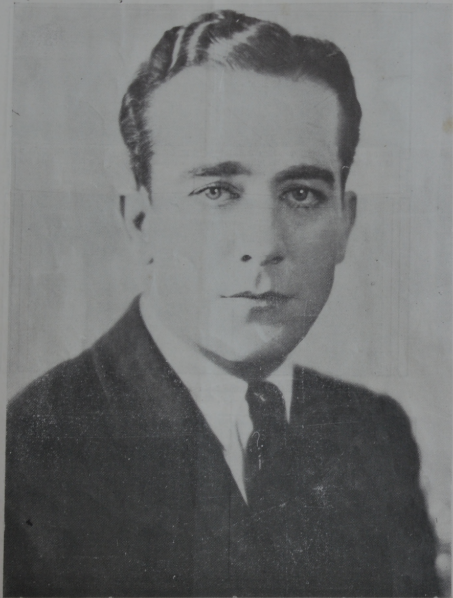
Eugenio O'Brien — Destacado artista de la pantalla