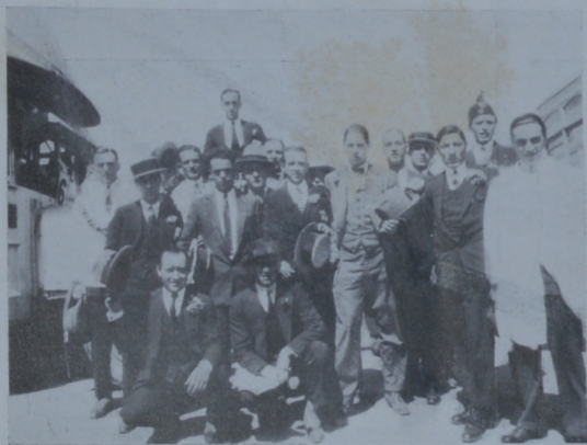
Un núcleo de bancarios en pose para el objetivo