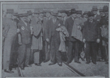
Los gerentes de Bancos argentinos rodeados de numerosos amigos al ser recibidos en el puerto para comenzar los festejos en su honor