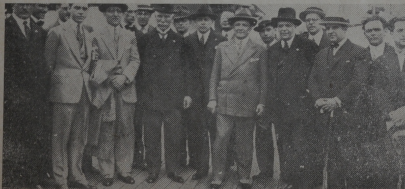
Médicos de la delegación

TABARE, que surge a la vida a luchar por los altos intereses de confraternidad americana acoge con simpatía y con amor todos estos actos de acercamiento espiritual e intelectual, entre los pueblos, que hermanan las condiciones étnicas y de raza.