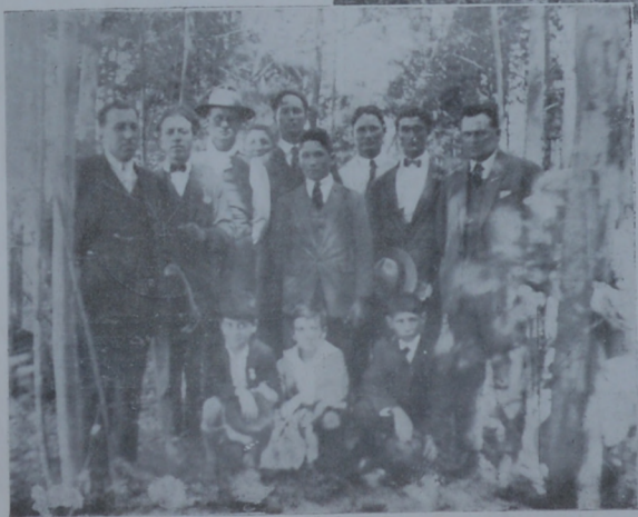
Peregrinación en San Bautista

Algunas de las personas que concurrieron a la peregrinación en San Bautista, localidad de Canelones