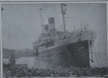
El transatlántico "Augustus" entrando a la Dársena Norte, donde fué recibido por numerosísimo público