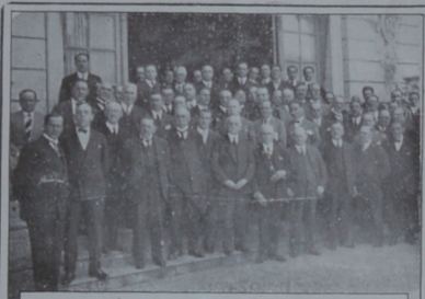
Grupo de concurrentes al almuerzo ofrecido en el Hotel del Prado por los corredores de Bolsa y al que asistieron caracterizadas personas