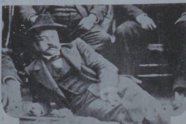
4.-Roxlo en los días de su apogeo político con más aspecto de caudillo criollo, que de poeta romántico.