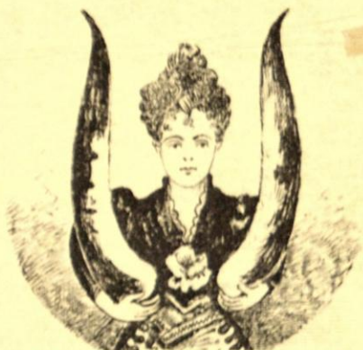
El non plus ultra de los regalos entre esposos.

—Que pase usted un año muy feliz. —Gracias... Si lo paso como lo deseas te daré un peso el 1° de Enero próximo.