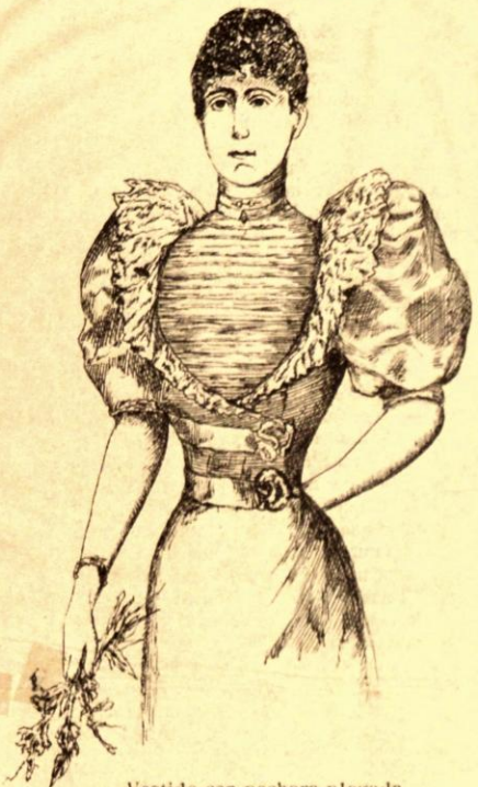
Vestido con pechera plegada