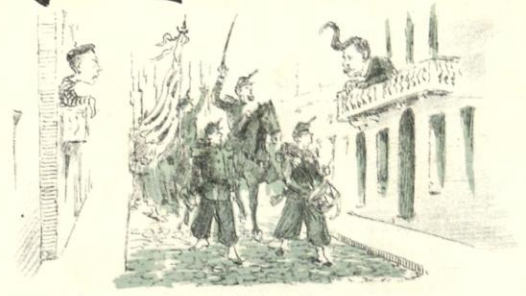
Para el riejo los saludos Y al nucco... los estornudos.