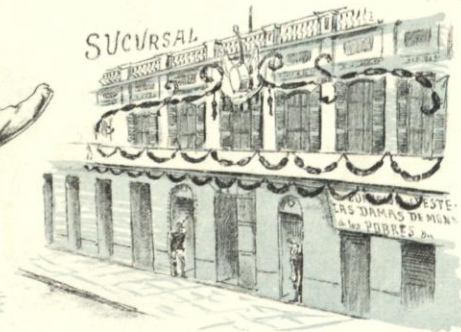
Lució un adorno especial La Candelaria Oficial.