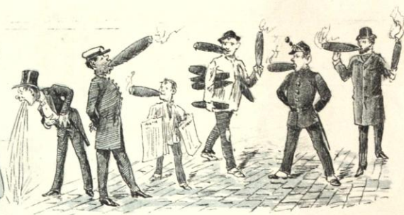
Consecuencias naturales De tabacos... oficiales.