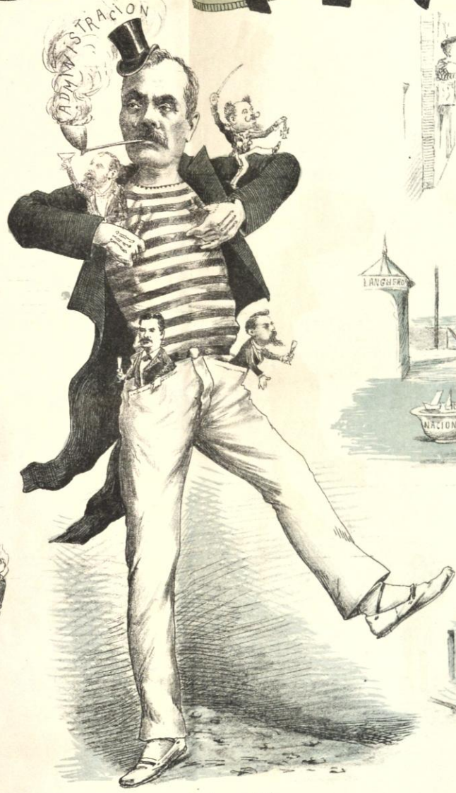
Por donde quiera que fui Bailé, comí y parore: Donde quisó me luci, Y en cada fiesta dejé Memoria eterna de mi.