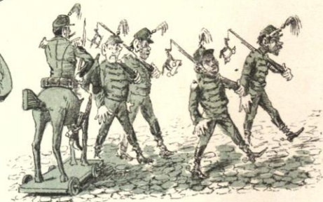
Caballeria... de á pié, Solo por aqui se vé.