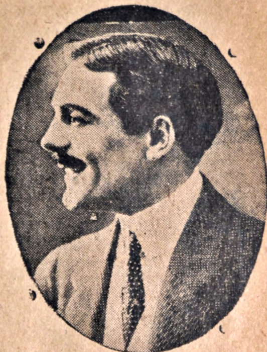
El Rey de la Risa

Y el insensible hombre de mirada dura, cayó ciegamente poseído de la diestra en el manejo de la palabra.