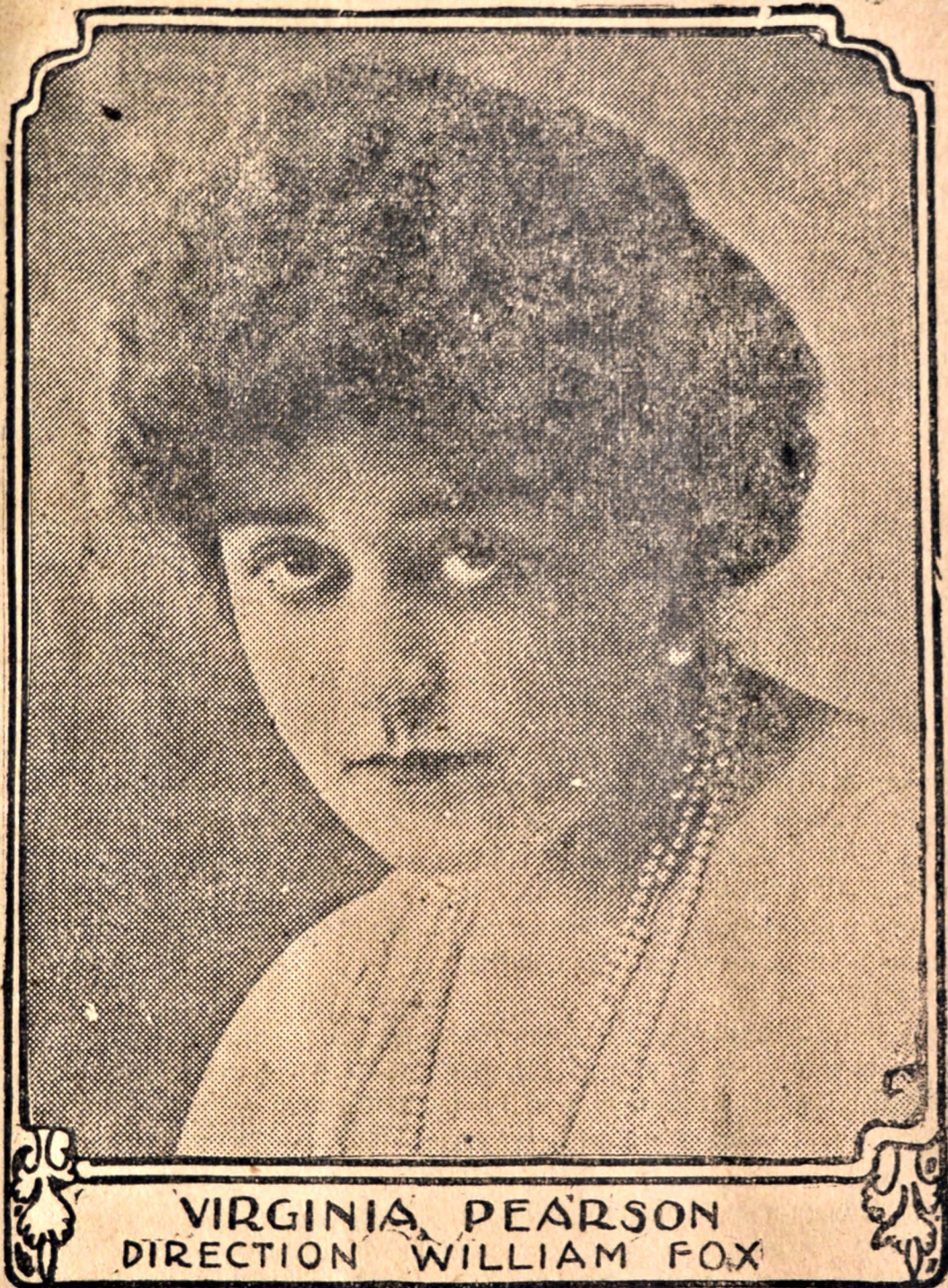
VIRGINIA PEARSON DIRECTION WILLIAM FOX

En los países donde los llamados a hacerlo, se preocupan de la instrucción, se ha pensado en utilizar el cinematógrafo como uno de los medios más adecuados a la enseñanza, ya que con él se puede conseguir el sumum pedagógico que consiste en enseñar, deleitando a la vez. Y de todo ello sacamos la consecuencia de que puede dejarse a los detractores sistemáticos del cinematógrafo, que nos hacen la impresión de unos canes ladrándole a la luna.