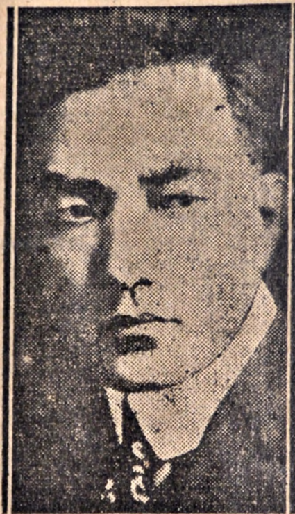
Sessue Hayakawa El gran trágico japonés

tográfica, en un hecho permanente y de actualidad durante largo tiempo en muchas partes del mundo.