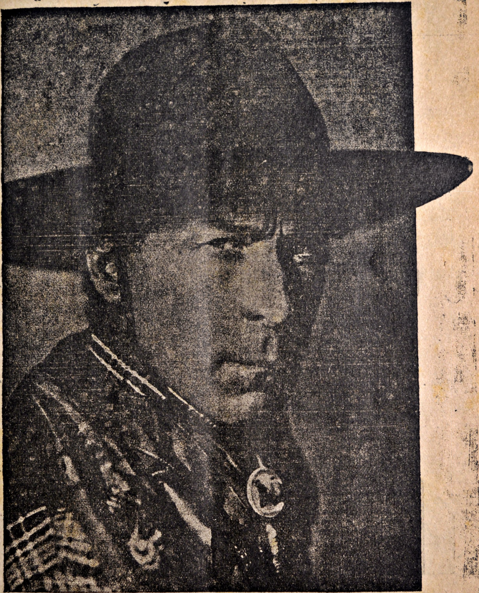
Williams S. Hart