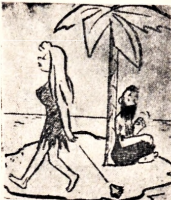
El tímido Robinson.