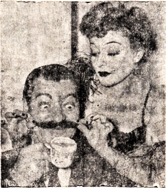
Escena captada por nuestro fotógrafo en el Festival de Cine de Punta del Este, como evidencia de todo lo que hay allí para "bigotear"...