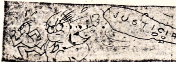
Corren los caseros una maratón frente al fantasma de la congelación.