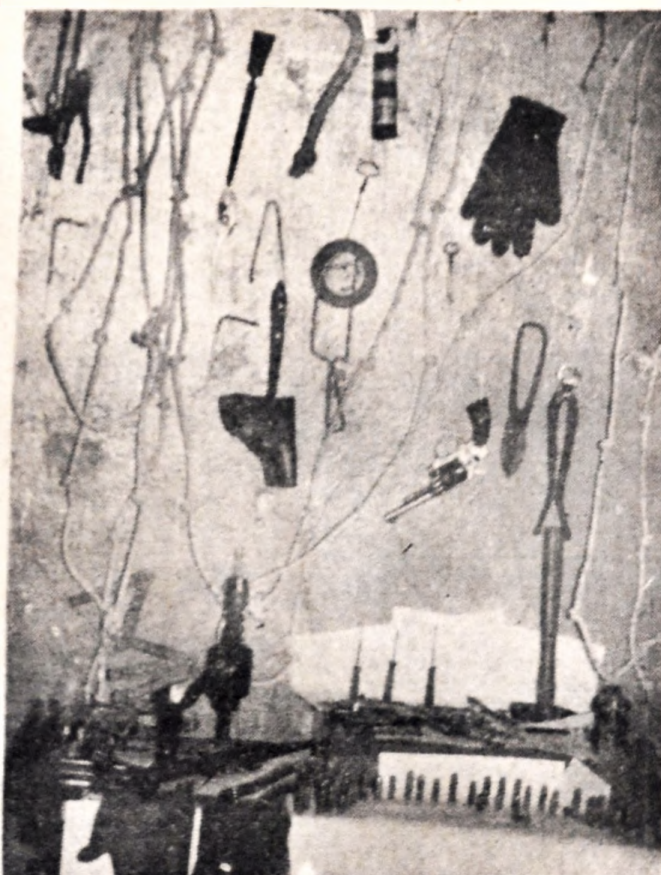
Instantánea obtenida en el cuarto de los juguetes del Cacho, el travieso chiquilín que tantas simpatías cuenta en nuestro ambiente.