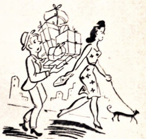
—Apurate, querido, que tengo una fiesta para celebrar los 16 años de Derechos Civiles de la Mujer.