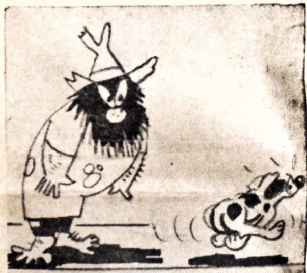
Futura imagen de un distinguido intelectual compatriota que tuvo confianza en que el gobierno pararía alguna vez las remuneraciones a la labor literaria, consagradas en la ley.