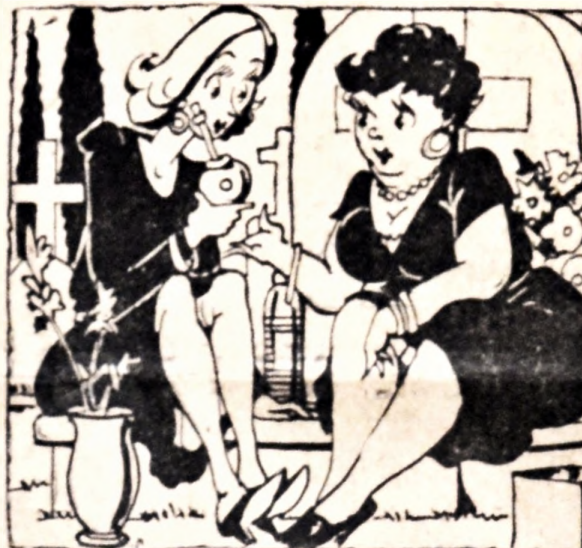
—Y entonces la Olga decidió empezar a fumar... Quiere ver si así los hombres se le van al humo.