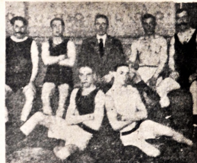
Delegación de funcionarios del Banco de Seguros del Estado que irá a entrevistarse con las autoridades de la institución a fin de solucionar pequeños problemas.