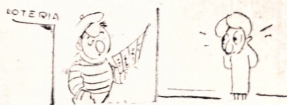
MADAME LAILA. — ¿No tiene un número terminado en 14, que fue el que me tocó cuando estuve en cana...?