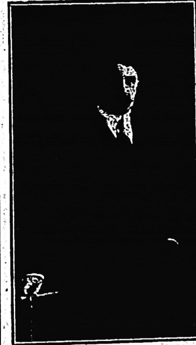
Dr. Joaquín Secco Illa

Los partidos deben ser fundados con fines ideológicos y prácticos, siempre levantados y generosos, sirviendo de vínculo de unión entre los afiliados, principios más o menos permanentes, pero siempre desinteresados, intergiversables, claros y bien definidos, capaces de hacer por sí solos, o por lo menos,