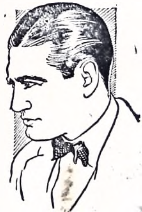
Richard Dix starring in Garamount Pictures

Los visitantes poseen un buen conjunto y como Albion alistarán un buen team es de esperarse una lucha emotiva. — G.