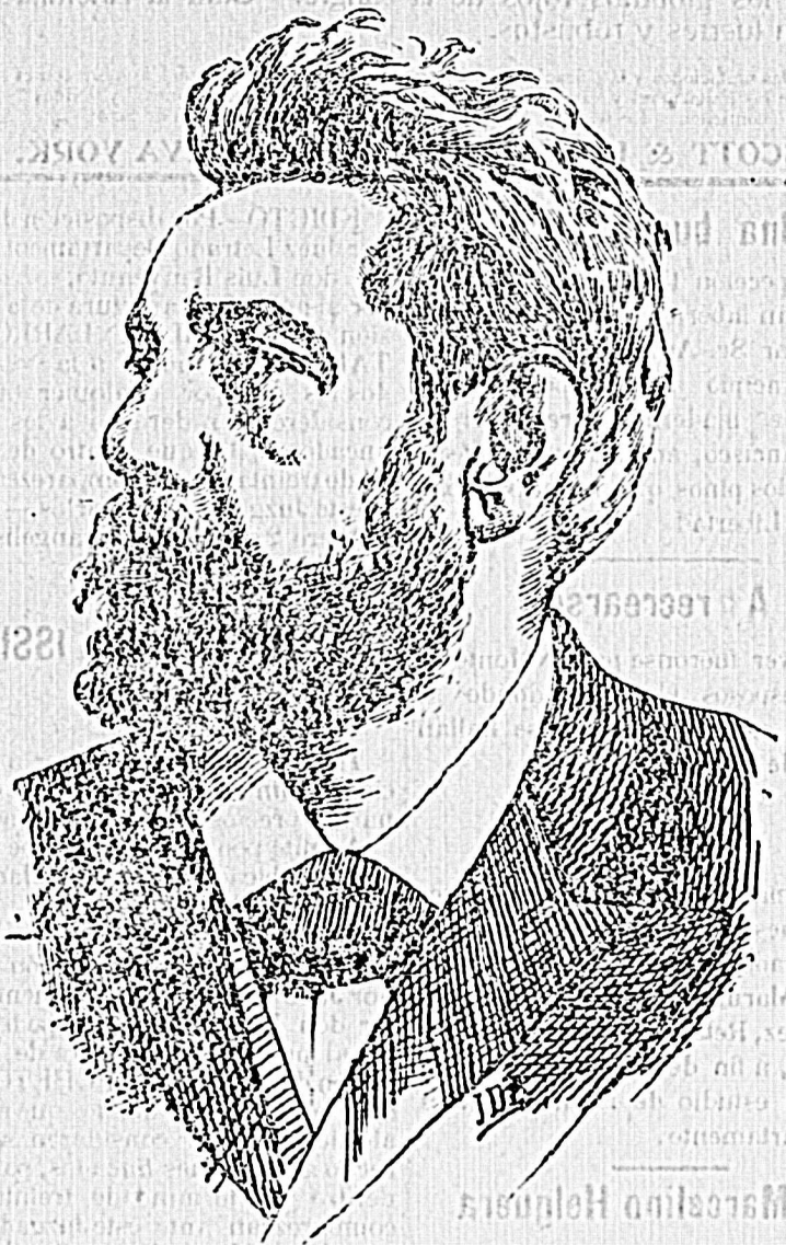
JOSÉ BATLLE Y ORDOÑEZ

No se admitirá escrito alguno que no esté amoldado a los principios de programa y garantido en debida forma. La publicidad de un escrito no autoriza la existencia gratuita del número.