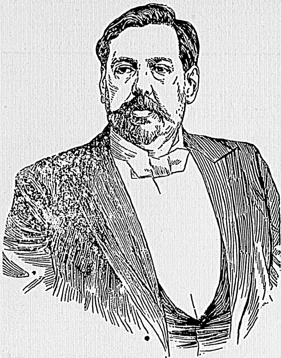
JOSÉ BATLLE Y ORDÓÑEZ

No se admitirá escrito alguno que no esté amoldado a los principios de progra- ma y garantido en debida forma. La publicidad de un escrito no autoriza exigen- cia gratuita del número.