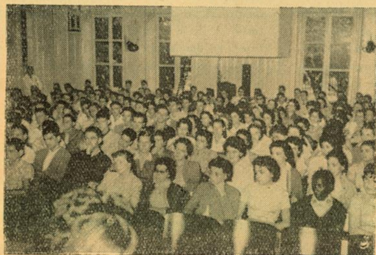
Los estudiantes, dominados por la oratoria extraordina- ria del conferencista, es- tán absortos...